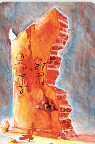
کودکان غزه - اثر: سیلوانو روسا/برزیل