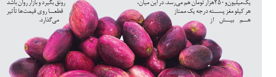
هر کیلو پسته درجه یک ممتاز یک میلیون و ۲۵۰ هزار تومان هم می رسد. در این میان، هم بیشتر از