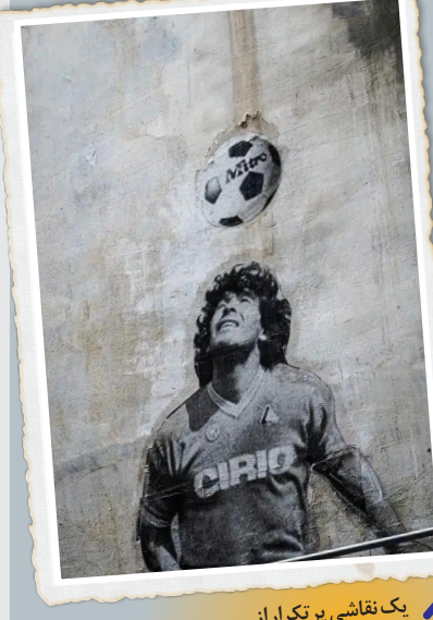
یک نقاشی بر تکرار از مارادونا در ناپولی

هم قهرمان کرد. او یکی از خود ناپلی‌ها شد؛ با همه لغزش‌ها و ارتباط تششان با مافیا و حرارت تشان برای زندگی و برای همیشه یکی از آنها باقی ماند. مارادونا در سال ۲۰۲۰ در ست در ۶۰ سالگی این دنیا را ترک کرد اما یادش و روحش تا زمانی که فوتبال برقرار است و ناپل نفس می‌کشد زنده خواهد ماند. امروز که تولد اوست، احتمالاً این ناپلی‌ها خواهند بود که بیشتر از مردم در هر جای دیگر دنیا، یاد مارادونا را زنده نگه خواهند داشت. مارادونا همچنان در خیابان‌ها و کوچه‌های ناپل زنده است. احتمالاً هیچ فوتبالیستی در هیچ شهری در دنیا به اندازه مارادونا در ناپل نقاشی دیواری و نقش‌های بزرگ و کوچک ندارد. به بهانه سالروز تولد این اسطوره تکرار نشدنی، برخی از این دیوارنگاره‌ها را برای تان در زیر آورده ایم.