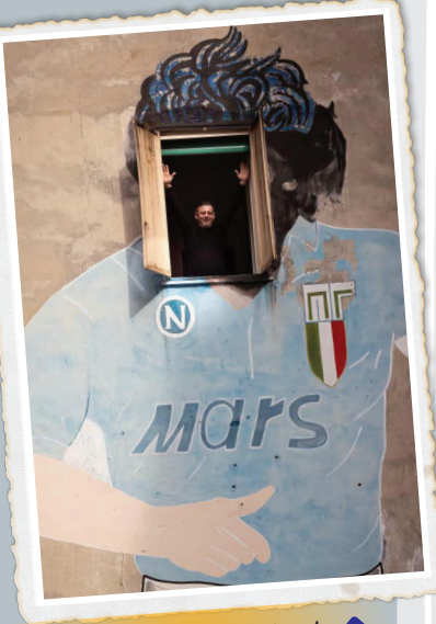
این نقاشی از مارادونا که صورتش روی یک پنجره افتاده، شهرت زیادی پیدا کرده و مالک خانه راهم حسابی مشهور کرده