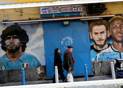
تصویری از جوانی مارادونا و ستاره‌های امروز ناپولی