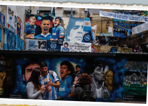
توریست‌ها با نقاشی‌های دیواری مارادونا سلفی می‌گیرند.