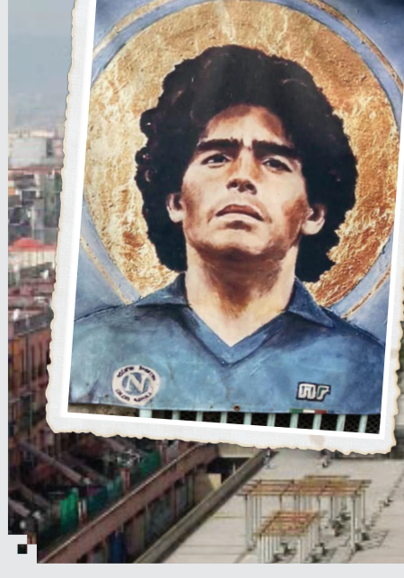
پرتره جوانی مارادونا با هاله‌ای مقدس دور آن