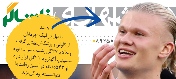
هالند با دبل در لیگ قهرمانان از کاوانی و پوشکاش پیشی گرفت و حالا با ۳۷ گل پشت سر اسطوره سیتی، آگونرو با ۴۱ گل قرار دارد. او ۵۴ دقیقه در این رقابت‌ها نتوانسته بود گل بزند.