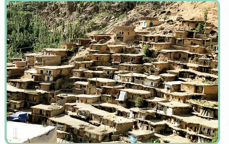
روستای پلکانی سر آقا سید - کوهرنگ

در نقشه زیر می‌توانید مسیر روستای گزستان به سمت پلکان باستانی را مشاهده کنید. این روستا تا پلکان باستانی دژپارت و پل خداآفرین حدود ۴۰ کیلومتر مسافت با درجه سختی زیاد در رفت و برگشت دارد؛ پس باید توان بدنی کافی و تجهیزات مناسب کوهنوردی و آب و غذا همراه داشت.