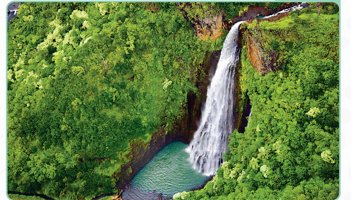
آبشار زیبای دره عشق - شهرکرد

روستای سر آقا سید یکی از روستاهای کوهستانی ایران به شمار می‌رود و ساختاری پلکانی دارد. این روستا میان کوه‌های زردکوه بختیاری واقع شده و شباهت زیادی به روستای ماسوله در استان گیلان دارد. به همین دلیل از آن با نام ماسوله زاگرس یاد می‌کنند. البته برخلاف روستای ماسوله، روستای سر آقا سید بین گردشگران چندان شناخته شده نیست و داخل این روستا رستوران و بازارچه سنتی وجود ندارد. شواهدی در اطراف روستا وجود دارد که براساس آنها کارشناسان قدمت آن را مربوط به دوره پارینه‌سنگی می‌دانند. به اعتقاد باستان‌شناسان، بسیاری از روستاهای کنده‌شده در دل کوه، از نخستین پناهگاه‌های انسان بوده است و قدمت آن به هزاران سال پیش می‌رسد. در حال حاضر تنها سند موجود از قدمت روستای سر آقا سید شجره‌نامه امامزاده آن است که سکونت فردی به نام آقا عیسی به‌همراه خویشاوندان او را بیش از ۶۰۰ سال پیش در این روستا نشان می‌دهد. این منطقه از مهم‌ترین نواحی کوچ بیلاقی عشایر کشور ما نیز به شمار می‌رود و اگر در فصل‌های بهار و تابستان به این منطقه سفر کنید، می‌توانید چادرهای عشایر را بر دامنه‌های سرسبز زاگرس ببینید.