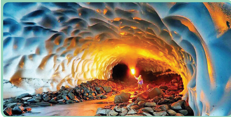
غار یخی جما - کوهرنگ

غار یخی جما: یکی از شگفت‌انگیزترین و دیدنی‌ترین غارهای ایران است که در شمال غربی استان چهارمحال و بختیاری قرار دارد و از جاهای دیدنی کوهرنگ محسوب می‌شود. این غار در نزدیکی روستای شیخ علیخان و ۲۵ کیلومتری چلگرد، از توابع شهرستان کوهرنگ واقع شده و غار جما از بزرگ‌ترین منابع آب شیرین کشور است.