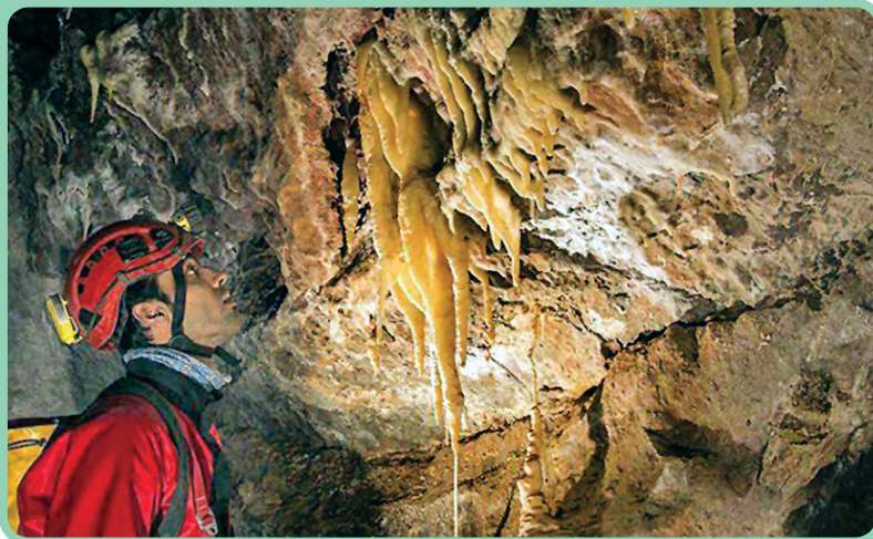
غار سراب - امیدآباد

غار سراب: یکی از غارهای آهکی بزرگ ایران است که در روستای امیدآباد شهرستان فارس قرار دارد. غار سراب از شهر فارس حدود ۲۱ کیلومتر فاصله دارد، اما نکته مثبت اینجاست که این فاصله آسفالت است و جز «دقیقه آخر مسیر که باید خود را از داخل روستا به غار برسانید، بقیه مسیر را می‌توانید با خودرو طی کنید».