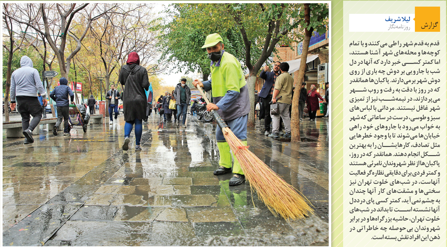
گزارش: لایلا شریف روزنامه‌نگار

گزارش میدانی همشهری از تلاش شبانه‌روزی پاکبانان برای تمیزی تهران