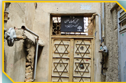
نام فعلی: هفت مسجد