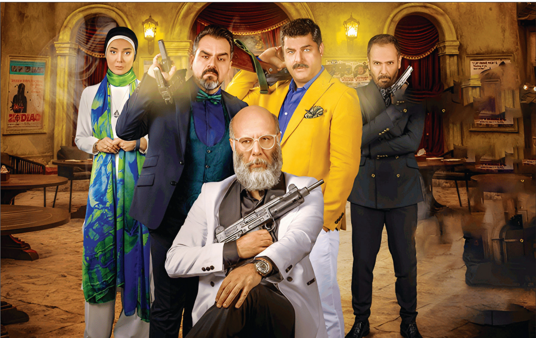
«شب‌های مافیا»؛ روزنامه‌نگار، یکی از رتالیته‌های به حاشیه‌مان روزه‌ها