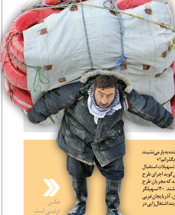
عکس تزئینی است.

مهرانی ادامه داد: برای این پروژه مهم و اثرگذار در حوزه ترانزیتی بیش از ۲۰۰ میلیارد تومان تاکنون هزینه شده و امیدواریم با پیشرفت اجرای پروژه، جاده جاسک به شهرستان زرباد در سیستان و بلوچستان متصل شود.