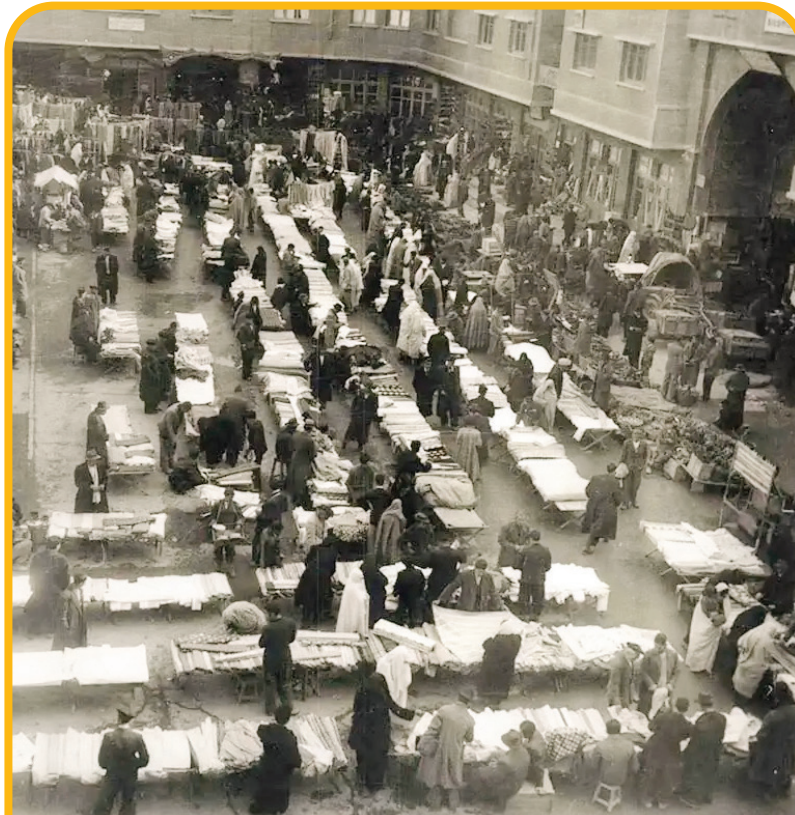
بازار تهران - زن جهانگرد ایتالیایی

نخستین زن گردشگر خارجی مادام کارلانسرا، نویسنده و جهانگرد معروف ایتالیایی است که پس از ۷ ماه اقامت در تهران سفرنامه‌ای با عنوان «آدم‌ها و آیین‌ها در ایران» در دوران ناصرالدین شاه می‌نویسد: «بازار، محل ملاقات و قرارهای عمومی است. آنجا مردم همچنان که درباره مسائل و منافع شخصی و تجاری خود بحث و گفت‌وگو می‌کنند، درباره مسائل عمومی و امور دولتی نیز به شور و تبادلی نظر می‌پردازند. به‌طور خلاصه، باید گفت که بازار جای بورس و مجلس را یکجا گرفته است. اما باز هم تعریف بازار کامل نیست و اخبار، شایعات، تهمت‌زدن‌ها، نشر اکاذیب، جنجال‌ها و بدگویی‌ها، همه از بازار سرچشمه می‌گیرند و دهان‌ها می‌گردند و مطابق معمول دست‌آخر، یک کلاغ چهل کلاغ می‌شود.»