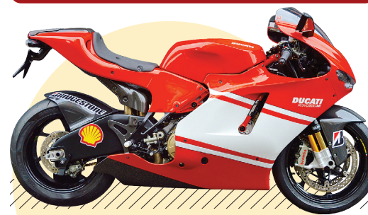
دوکاتی دزموزدیچی آر آر