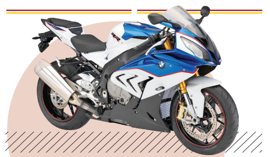
بی‌ام‌دبلیو اس ۱۰۰۰ آر آر