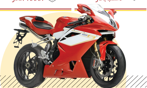
ام‌وی آگوستا اف ۴ آر ۳۱۲