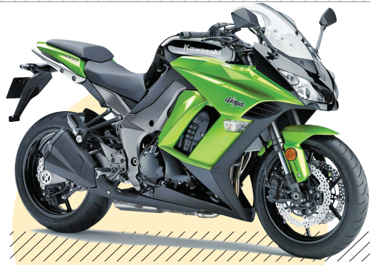
کاوازاکی نینجا زد ایکس-۱۴