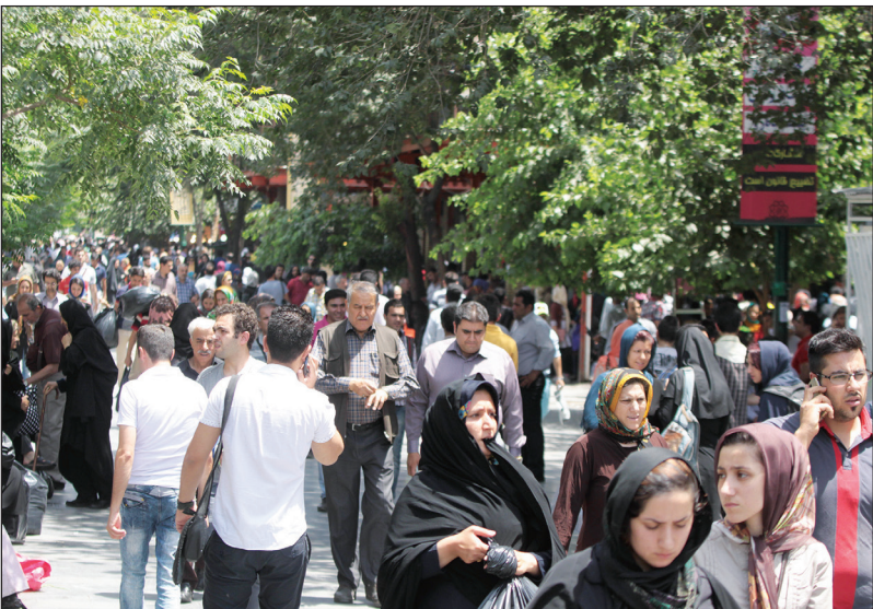
جمعیت فراوانی از مردم در خیابان‌های تهران، بسیاری از آنها با حجاب معاصر.

حجاب معاصرت، چگونه مانع از کلان‌نگری ما می‌شود؟