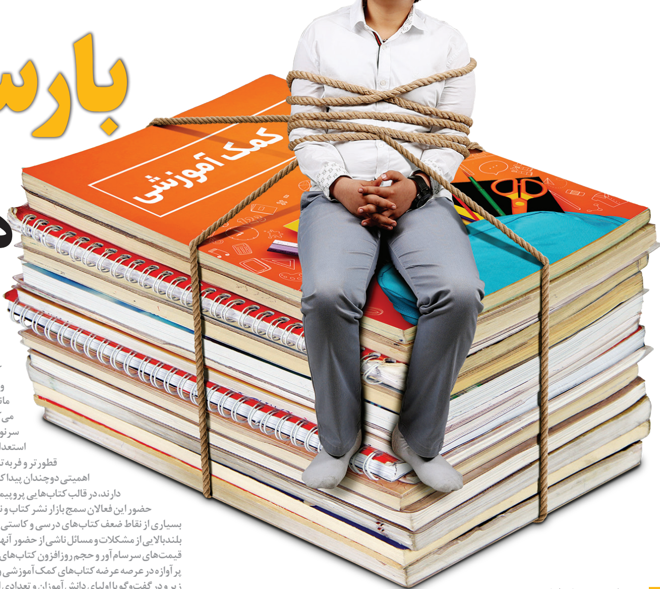
تصویرسازی: همنشهری/ بهرام غروی