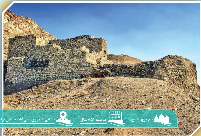
نام: برج اینانج قدمت: ۸۵۴ سال نشانی: شهرری، تقی آباد، خیابان ترابی

هم معروف می‌شود. طبق منابع تاریخی در حفاری‌ها توسط قاچاقچیان در دوره قاجار و پهلوی اول اشیاء و عتیقه‌های گرانبایی همچون پارچه‌هایی مربوط به دوره آل بویه کشف و به سرقت برده شد و به گفته مردم محلی، سرقت شمشیر و خنجر هم گزارش شده است. آنچه از گنبد یا گور اینانج بر بالای کوه طبرک باقی مانده، محوطه وسیع مدوری است که قطر دایره آن بیشتر از ۳۶ متر است. نیمی از دیواری که گنبد را محصور می‌کند، به دلیل شیب طبیعی کوه به تدریج رو به بالا می‌رود و نیمه جنوبی حصار بر شالوده‌ای استوار است که از پایین کوه با سنگ و گچ ساخته بودند. در میان این برج وسیع، بنایی از آجر و گچ ساخته بودند که در آن ۲ حفره به صورت قبر رو به قبله وجود داشت.