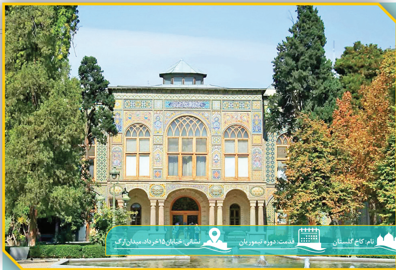
نام: کاخ گلستان قدمت: دوره تیموریان نشانی: خیابان ۱۵ خرداد، میدان آرگ

جالب است بدانید که برج اینانج چند نام دیگر هم دارد. برای مثال، خواجه نظام الملک در کتابش از این برج به نام «دیده سپهسالار» یاد کرده است. همچنین این برج میان مردم محلی در دوره معاصر به نام «برج یزید» شهرت داشت. گویا قاچاقچیبانی که اغلب شان روس بوده‌اند با علم به اینکه ایرانیان همواره بر یزید لعنت می‌فرستند و از هر کس بدشان بیاید او را یزید خطاب می‌کنند، با هدف دور کردن اهالی از این محدوده و به قصد حفاری و سرقت آثار باستانی فارغ از مزاحمت مردم، اینجارا یزید می‌نامند و به تدریج این برج به برج یزید