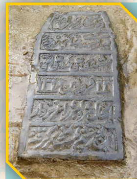
نام: سنگ قبرهای قدیمی