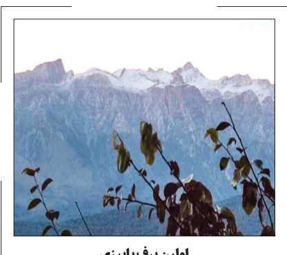
اولین برف پاییزی در ۱۲ استان

ارتفاعات تاش و شاهوار در شهرستان شاهرود و ارتفاعات قله نیزوا در شهرستان مهدی شهر استان سمنان با بارش برف سفیدپوش شده‌اند. همچنین نخستین برف پاییزی، ارتفاعات دودانگه در شهرستان ساری استان مازندران را هم سفیدپوش کرد.