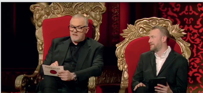
علاءالدین گیم‌شو، کارنامه

چه حال و هوایی دارد، بگذارد یکی از آنها برای تان شرح دهیم. در اپیزود اول سری چهارم، این برنامه بریتانیایی، شرکت‌کنندگان باید از طبقه بالای یک ساختمان دستمال‌های کاغذی نارنجی و آبی‌رنگ را به داخل توالت فرنگی‌ای که در طبقه همکف قرار دارد، برتاب کنند. ترکیب کمدی، تمرکز و دقت در برتاب.