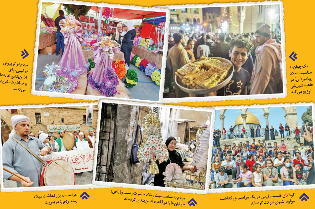
مردم در تبریزی در لباس‌های آذین‌بندی شده برای جشن و خیابان‌ها، خرید می‌کنند. مراسم بزرگداشت میلاد پیامبر (ص) در بیروت. کودکان فلسطینی در یک مراسم بزرگداشت مولود النبوی شرکت کرده‌اند. مردم به مناسبت میلاد حضرت رسول (ص) خیابان‌ها را در قاهره آذین‌بندی کرده‌اند.

میلاد رسول اکرم (ص)، از بزرگ‌ترین جشن‌هایی است که مسلمانان در سراسر دنیا دارند و هر ساله، با شوق و شور فراوان آن را برگزار می‌کنند و در بسیاری از کشورهای مسلمان، این روز تعطیل عمومی است. مسلمانان در این روز، به زندگی و میراث حضرت رسول (ص) که بزرگ‌ترین شخصیت دین اسلام است، می‌پردازند. تاریخ دقیق روز تولد حضرت رسول (ص) که در بیست‌وپنجا روز نام مولود