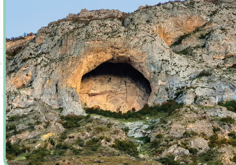
غار اسپهد خورشید - منطقه خطیرکوه

جاده فیروزکوه و قلعه‌هایش را که بگذارد کنار گردنه گدوک خودش یک ماجرای اسرارآمیز است. اگر حتی یک‌بار به این جاده سفر کرده باشید امکان ندارد این گردنه شما را شگفت‌زده نکند و انگار وارد خانه فرار شده‌اید. از کولاک و گیر کردن در برف شروع می‌شود و با مهی غلیظ که مرگ را جلوی چشم‌تان ببینید، ادامه پیدا می‌کند و پس از برف و کولاک و مه ناگهان آفتاب چراغ راهتان می‌شود. این گردنه همین قدر غافلگیرکننده و ترسناک است. در کنار همه شگفتی‌هایی که طبیعت این منطقه به رخ می‌کشد کاروانسرای وجود دارد که داخلش بوی گازوئیل و روغن سوخته می‌دهد و از سقف و در و دیوارش دوده‌ای سیاه چکه می‌کند و مهم‌تر اینکه اینجا نقطه شروع ساخت‌وسازها در دروازه کاسپی است. داخلش که شدید همه‌مان از حال و اوضاعی که داشت آهی کشیدیم. می‌گویند قدمتی صفوی دارد و یکی از ۹۹۹ بنا در مسیر اصفهان تا مازندران است که به دستور شاه عباس صفوی