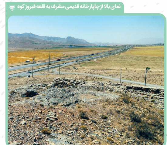
نمای بالا از چاپارخانه قدیمی مشرف به قلعه فیروزکوه