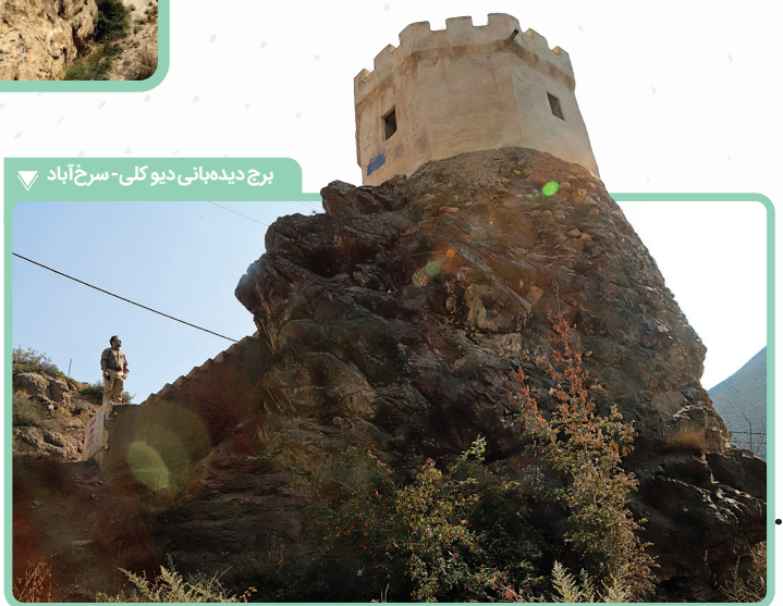
برج دیدهبانی دیوکل - سرخ‌آباد