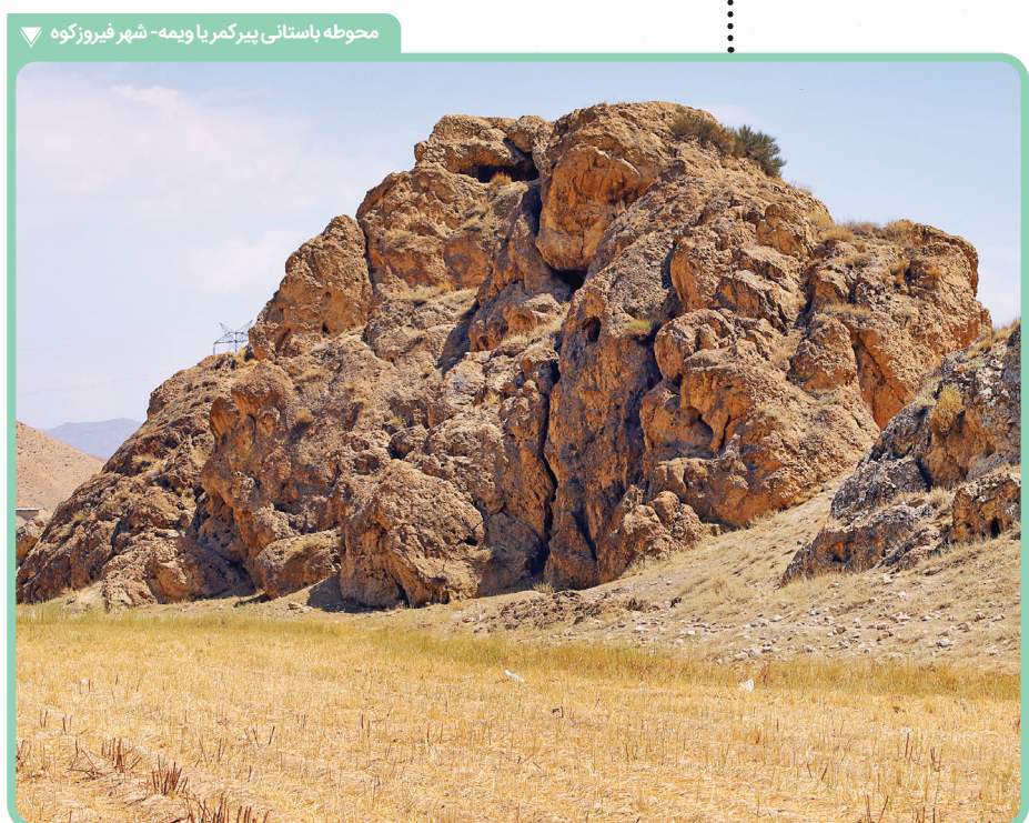
محوطه باستانی بیرگمربا ویمه - شهر فیروزکوه