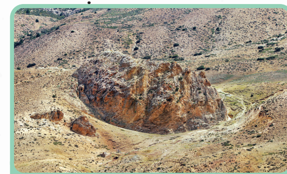
دژ شاه‌چشمه - کنار ایستگاه راه‌آهن گدوک