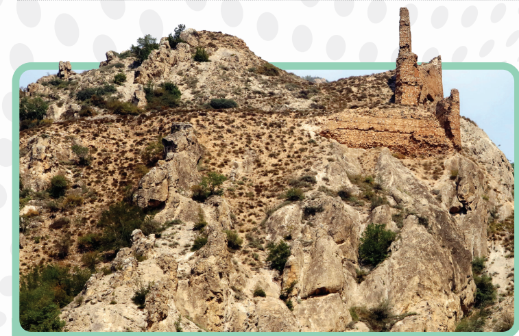
دژ مازنار - جاده فیروزکوه، نرسیده به ورسک