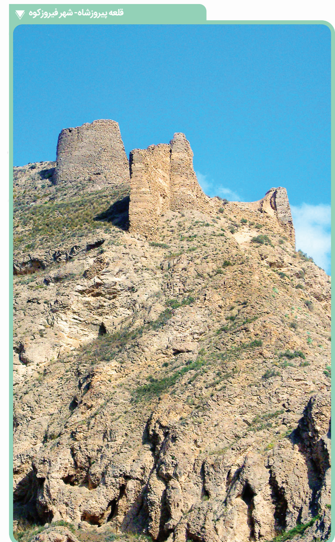
قلعه پیروزشاه - شهر فیروزکوه