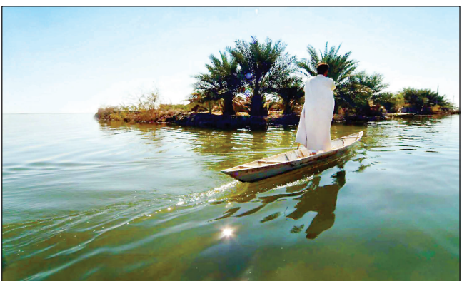
رئیس‌جمهور ایران در تالاب شادگان، استان خوزستان.

معاون محیط طبیعی اداره کل حفاظت محیط زیست خوزستان از موافقت رئیس‌جمهور با تأمین اعتبار و اجرایی شدن طرح جامع گردشگری تالاب شادگان خبر داد.