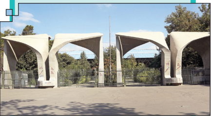
عنوان: زمین، ساختمان، معازه، مجسمه و...