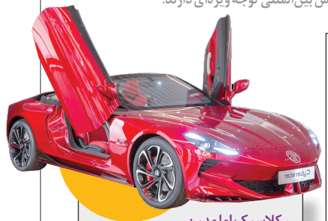
کلاسیک اما مدرن شرکت ام‌جی، خودروی سایبرستر (MG Cyberster) را برای نخستین بار در اوایل سال جاری میلادی در نمایشگاه خودروی شانگهای به نمایش گذاشت، اما حالا برای نخستین بار آن را به اروپا آورده است. این خودرو براساس معماری خودروهای برقی ساخته شده است که ام‌جی ادعا می‌کند به وسیله نقلیه اجازه می‌دهد با یک بار شارژ باتری، ۸۰۰ کیلومتر رانگی کند. ام‌جی می‌گوید در این مدل از طراحی کلاسیک برند استفاده می‌کند، اما از ویژگی‌هایی مانند کابین بازی و اتصال 5G بهره می‌برد.

برگزاری است و سازندگان با انواع طرح‌ها و خودروهای مفهومی در آن حاضر شده‌اند. به گزارش همشهری آنلاین، به نقل از سی‌ان‌بی‌سی نیوز، موضوع این نمایشگاه که امروز به پایان می‌رسد، برقی‌سازی بود و بازیگران بزرگی مانند BMW و مرسدس بنز خودروهای الکتریکی خود را در آن به نمایش گذاشتند. تعداد زیادی از خودروسازان چینی هم در این نمایشگاه حضوری فعال داشتند، چراکه آنها به گسترش بین‌المللی توجه ویژه‌ای دارند.