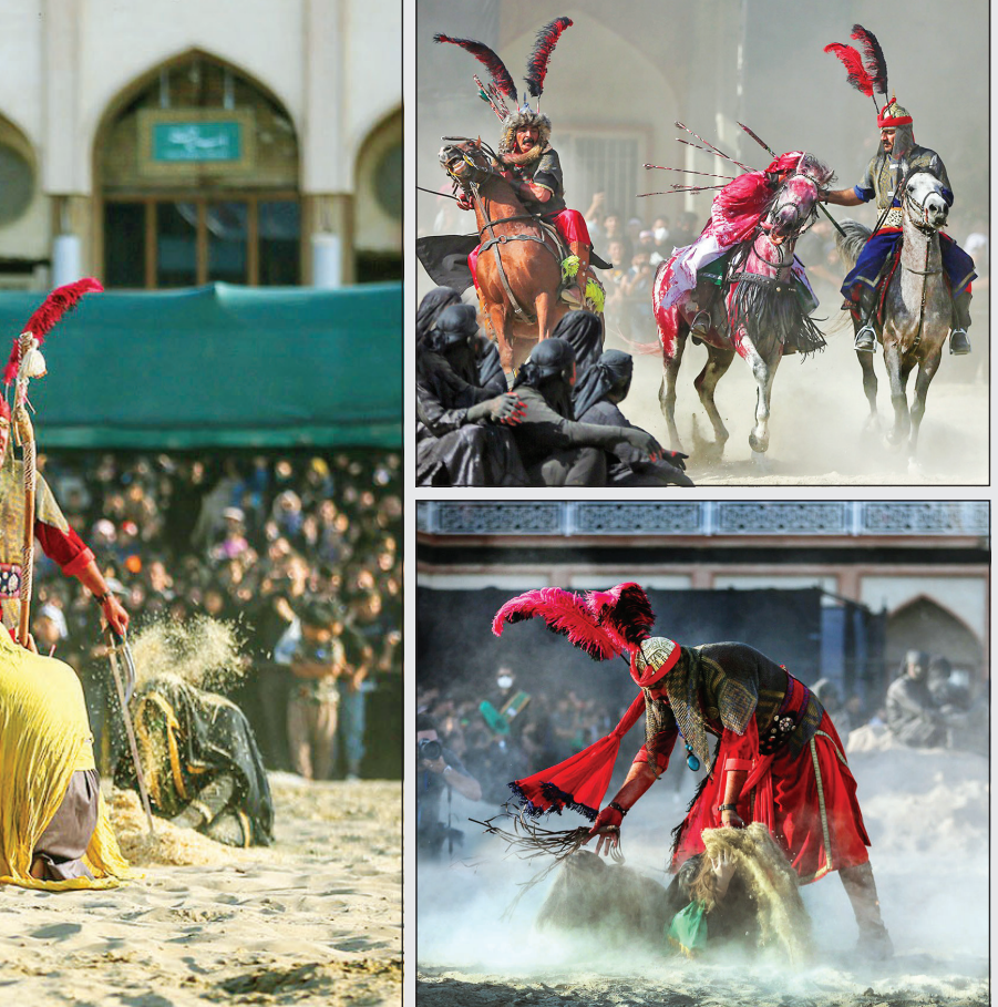
تغزیه روز اربعین در امامزاده شاه کرم اصفهان