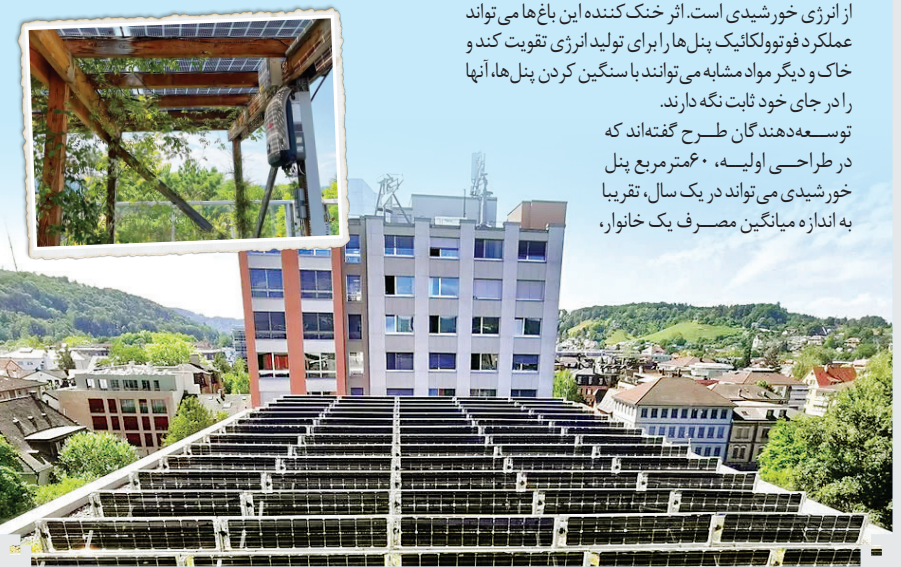
توسعه دهندگان طرح گفته اند که در طراحی اولیه، ۶۰ متر مربع پنل خورشیدی می تواند در یک سال، تقریباً به اندازه میانگین مصرف یک خانوار،

آخرین چیزی که در اقلیم اروپایی وین می توان انتظار داشت، واحه است اما دانشجویان دانشگاه منابع طبیعی پایتخت اتریش، در طرحی ابتکاری، بام خانه ها را به اقلیم های نو تبدیل می کنند. چیزی که آنها واحه می خوانند، ترکیب باغ های پشت بامی (روف گاردن) و پنل های خورشیدی است که نوع جدیدی از باغ را در این شهر ایجاد می کند. این واحه ها در شکل های مختلفی ساخته می شوند؛ از مدل هایی که پنل و گل و گیاهان، همینطور روی سقف کنار هم قرار داده می شوند گرفته تا انواع دیگری که پنل و گیاهان، از داربست هایی در ارتفاعی حدود ۲ متر آویزان می شوند. واحه های محبوب همین نوع اخیر هستند که مردم می توانند زیر گل و گیاه آن بنشینند و همزمان از سایه و نور بهره ببرند. این باغ ها از چندین لایه مواد مختلف تشکیل می شوند که آب بندی، زهکشی، خاک و پوشش گیاهی را فراهم می کنند. البته مزایای فراوانی هم دارند؛ سقف خانه ها و ساختمان ها را خنک و آب باران را حفظ می کنند، گونه های مختلف جانسوری را به خود جلب و خوشایندتر از همه آنها برای ساکنان شهر این که فضای دلپذیری را برای آنها فراهم می کنند. با توجه به نیاز شهر به انرژی های تجدیدپذیر، ترکیب باغ و پنل های خورشیدی است. اثر خنک کننده این باغ ها می تواند عملکرد فوتوولتائیک پنل ها را برای انرژی تر تقویت کند و خاک و دیگر مواد مشابه می توانند با سنگین کردن پنل ها، آنها را در جای خود ثابت نگه دارند.