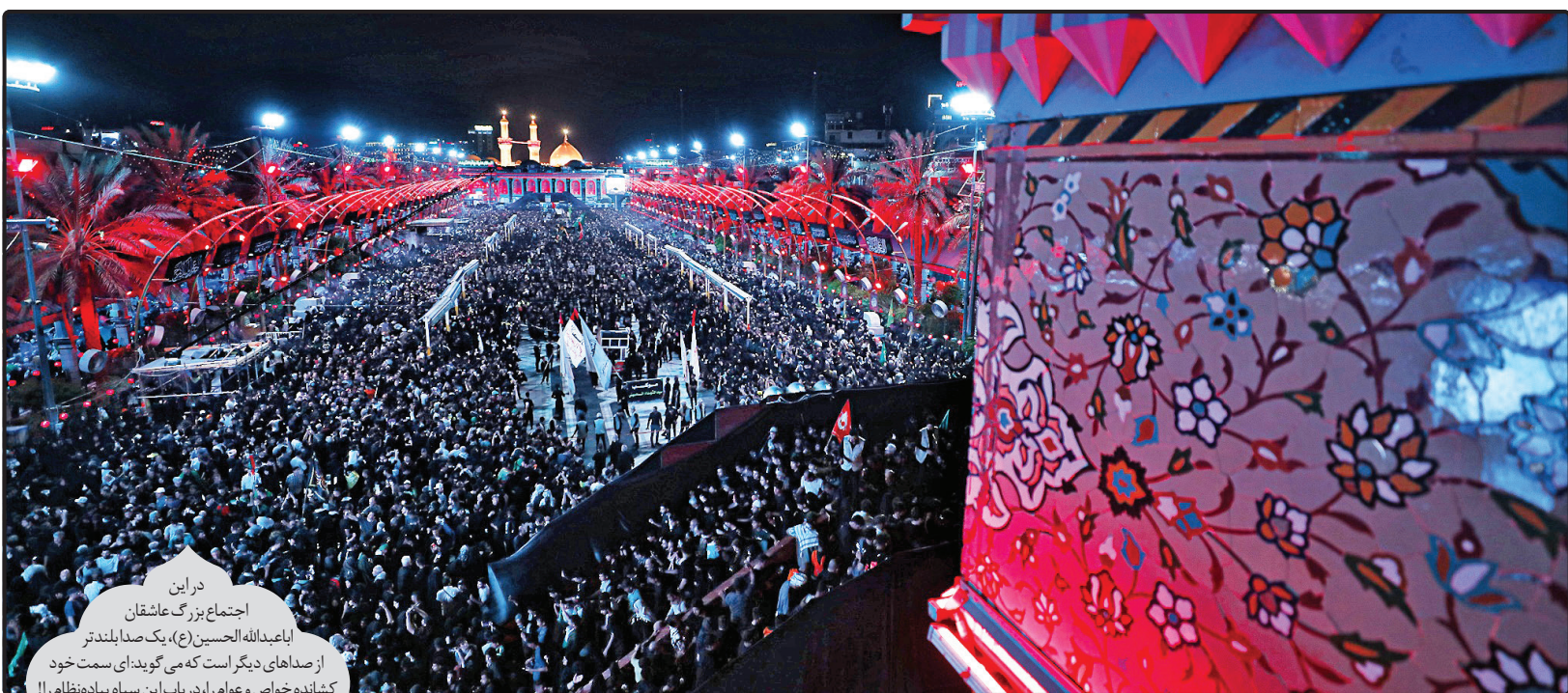
در این اجتماع بزرگ عاشقان اابعبدالله‌الحسین (ع)، یک صدا بلندتر از صداهای دیگر است که می‌گویند: ای سمت خود کشانده خواص و عوام را، در یاب این سپاه پیاده‌نظام را!!