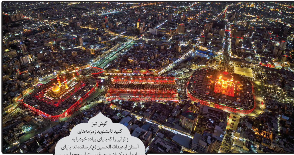
گوش تیز کنید تا بشنوید زمزمه‌های زائرانی را که با پای پیاده خود را به استان اابعبدالله‌الحسین (ع) رسانده‌اند: با پای پیاده آمدیم کربلا، در هر قدمی ثواب حج دارم من.

قرار عاشقانه زائران اابعبدالله‌الحسین (ع) در هر اربعین تکرار می‌شود و تاریخ یکبار دیگر به یاد می‌آورد این عهد تشیع گسستنی نیست و تا دنیا دنیاست، زائرانی از هر گوشه جهان به عشق سیدوسالار شهیدان کربلا؛ امام حسین (ع) پای پیاده خود را به آستان نورانی این امام همام می‌رسانند تا با تجدید عهد با مولای خود، جهان و جهانیان را با اجتماع میلیونی خود در کنار بارگاه حضرت دوست شگفت زده کنند. این اربعین هم با زیبایی‌ها و شگفتی‌های بسیار تکرار شد و خوشایه به سعادت زائرانی که امسال هم قرعه عشق به نام‌شان خورد و اربعین کربلایی شدند.