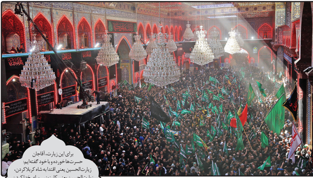
برای این زیارت، آقاجان حسرت‌ها خورده و یا خود گفته‌ایم: زیارت‌الحسین یعنی افتخار به شاه کربلا کردن، زیارت‌الحسین یعنی کار زینبی برای خدا کردن.

امسال هم اجتماع میلیونی زائران اربعین باشکوه بیشتر رقم خورد