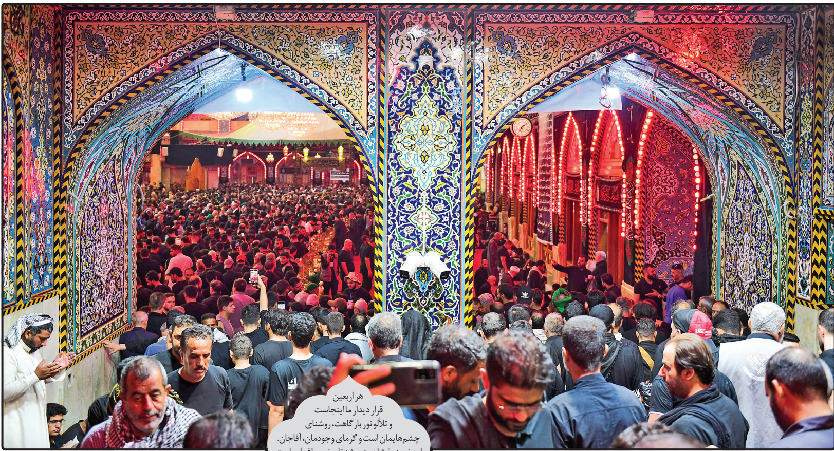
هر اربعین قرار دیدار ما اینجاست و تا گوی بارگاهت، روشنائی چشم‌هایمان است و گرمای وجودمان، آقاجان. این نور درخشان، همیشه تاریخ، چراغ راه ماست.