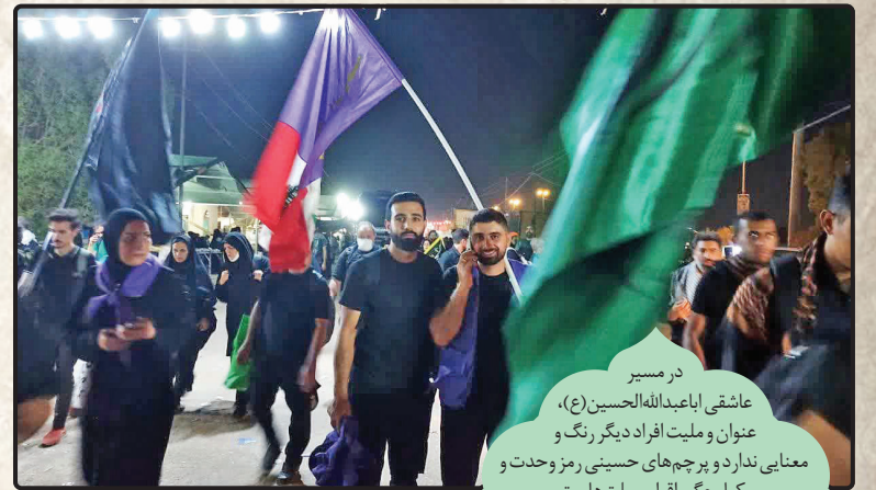
در مسیر عاشقی اباعبدالله (ع)، عنوان و ملیت افراد دیگر رنگ و معنایی ندارد و پرچم‌های حسینی رمز وحدت یکپارچگی اقوام و ملت‌هاست.