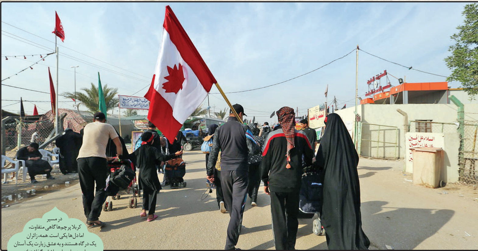
در مسیر کربلا پرچم‌ها گاهی متفاوت، امادها یکی است. همه، زائران یک درگاه هستند و به عشق زیارت یک آستان پای به جاده‌های عاشقی گذاشته‌اند.

در این موسم، بسیاری از تفاوت‌ها رنگ می‌بازد و وحدت و یکپارچگی جایگزین بسیاری از اختلافات سلیقه‌ای و حتی ملیت‌های گوناگون می‌شود. پرچم‌های مختلف از ملیت‌های گوناگون زیر یک پرچم واحد مزین به نام و نهضت عاشورا، گرد هم می‌آیند و این یکی از زیبایی‌های آیین پیاده روی اربعین حسینی است که هر بار باشکوه هر چه بیشتر از قبل تکرار و باعث شگفتی جهانیان می‌شود: اتفاق مبارکی که باید بیش از پیش پاس داشته شود.