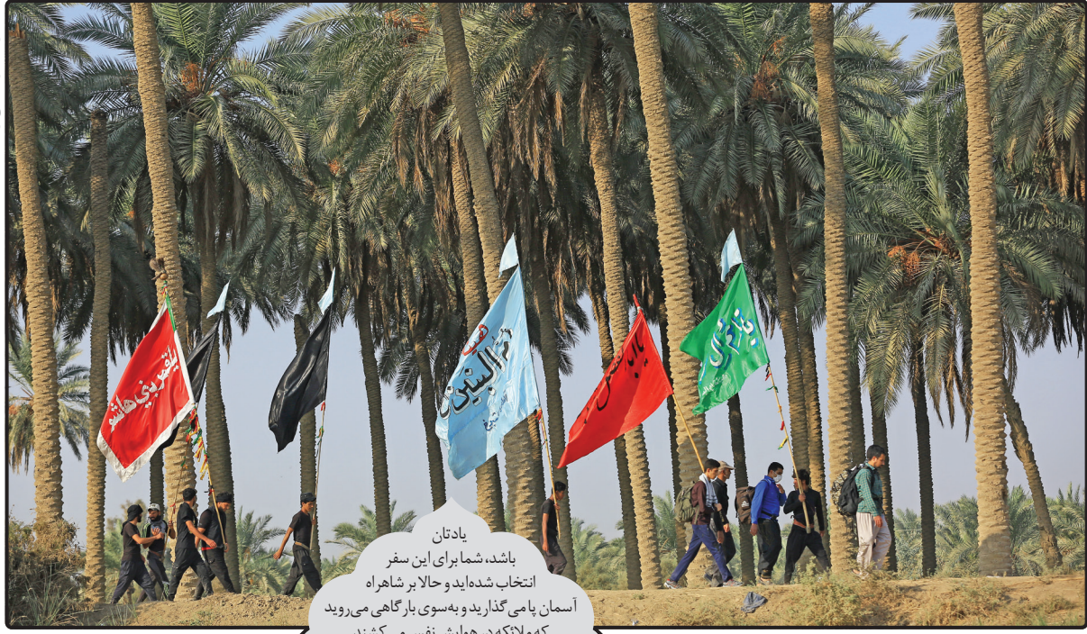
یادتان باشد، شما برای این سفر انتخاب شده‌اید و حالا بر شاهراه آسمان پامی گذارید و به سوی بارگاهی می‌روید که ملائکه در هوایش نقش می‌کشند.

وقتی پا در مسیرهای متعدد و گاه طولانی پیاده روی می‌گذارند، به مفهوم «مسیر» در رسیدن به «مقصد» هم می‌اندیشند که بارها در جای تاریخ سرنوشت ساز شده‌اند. برای مسافران اربعین حسینی هم این مسیرها بیگانه نیست؛ چرا که سال‌ها و حتی قرن‌ها محلی برای عبور مسافران کربلا بوده است. به غیر از «طریق الحسین» (جاده نجف به کربلا) که راه اصلی پیاده روی اربعین است، زائران اربعین حسینی از ۳ مسیر دیگر کاظمین، حله و طریق العلما راهی زیارت حرم امام حسین (ع) می‌شوند.