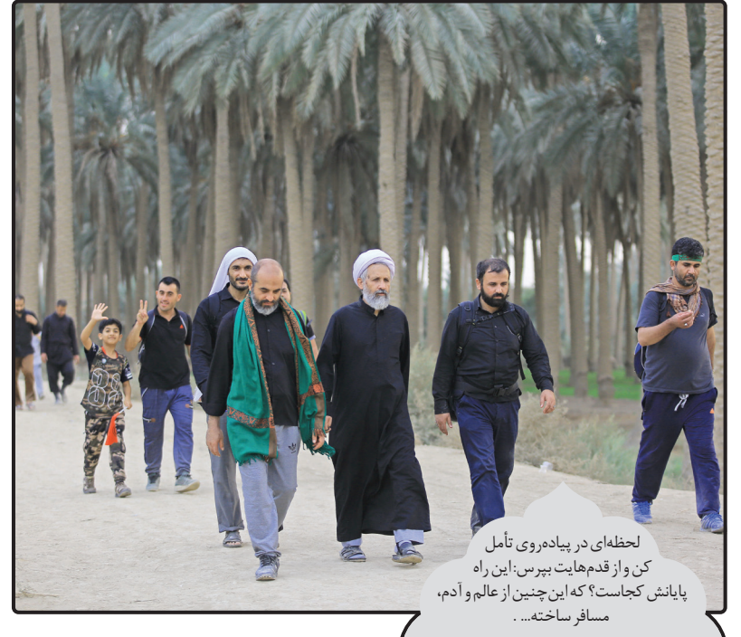
لحظه‌ای در پیاده روی تأمل کن و از قدم‌هایت بپرس: این راه پایانش کجاست؟ که این چنین از عالم و آدم، مسافر ساخته...