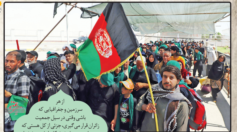
از هر سرزمین و جغرافیایی که باشی وقتی در سبیل جمعیت زائران قرار می‌گیری، جزئی از کل هستی که هویت واحدی به نام شیفتگان اهل بیت (ع) دارد.