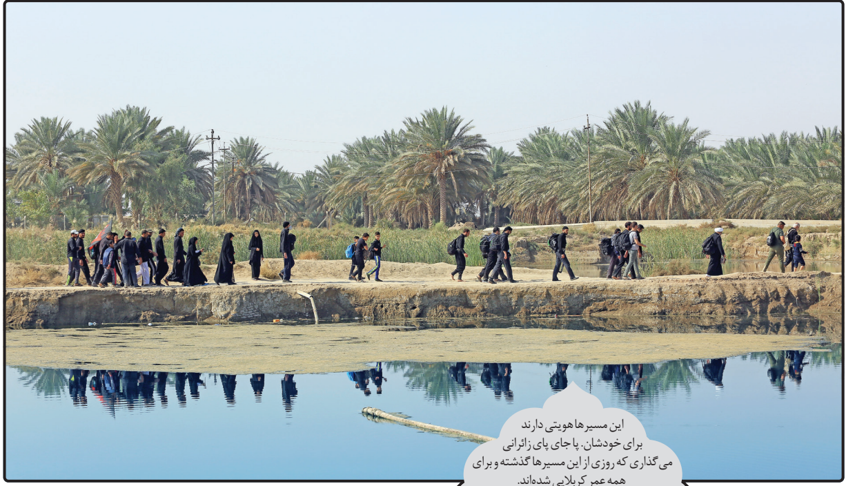
این مسیرها هویتی دارند برای خودشان. یا جای پای زائرانی می‌گذاری که روزی از این مسیرها گذشته و برای همه عمر کربلایی شده‌اند.