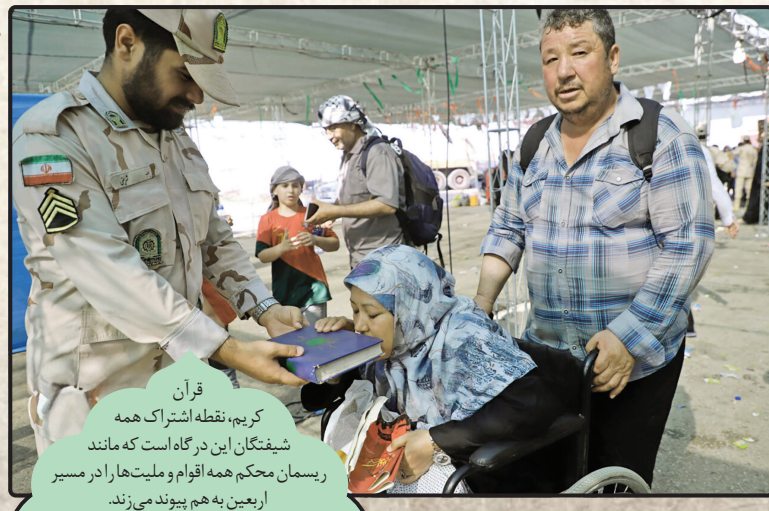
قرآن کریم، نقطه اشتراک همه شیفتگان این درگاه است که مانند ریسمان محکم همه اقوام و ملیت‌ها را در مسیر اربعین به هم پیوند می‌زند.