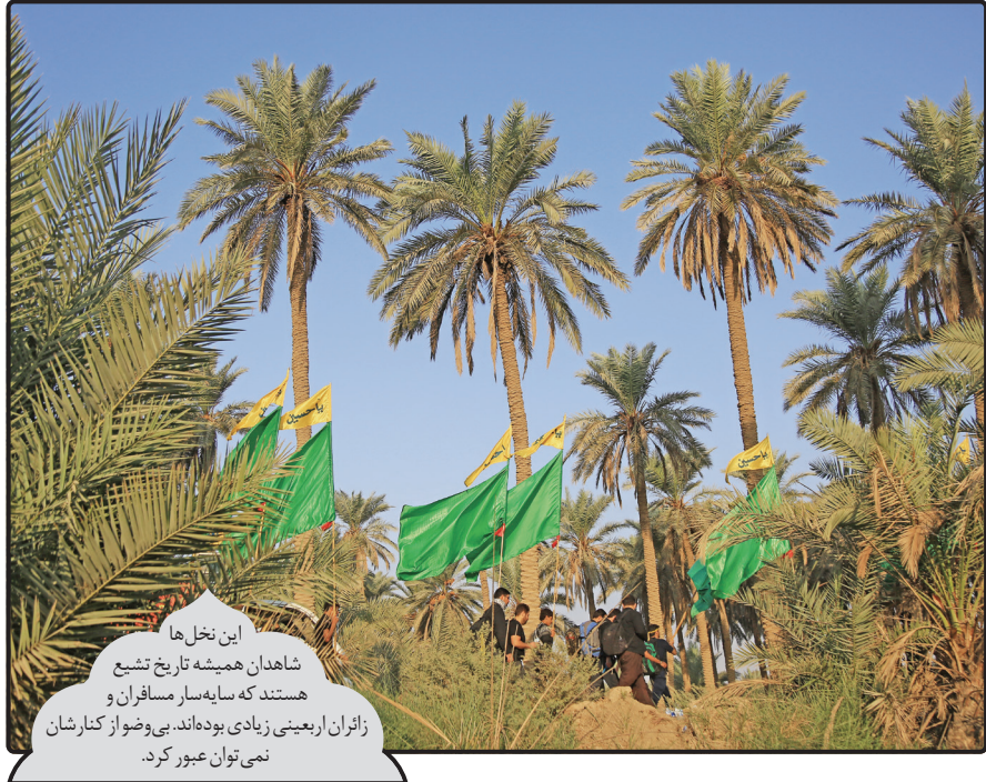
این نخل‌ها شاهدان همیشه تاریخ تشیع هستند که سایه‌سار مسافران و زائران اربعینی زیادی بوده‌اند. بی‌وضو از کنارشان نمی‌توان عبور کرد.