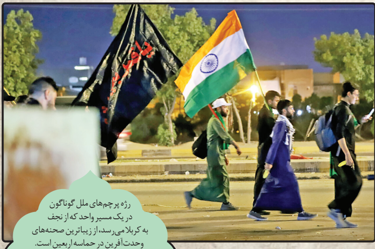
رژه پرچم‌های ملل گوناگون در یک مسیر واحد که از نجف به کربلا می‌رسد، از زیباترین صحنه‌های وحدت‌آفرین در حماسه اربعین است.