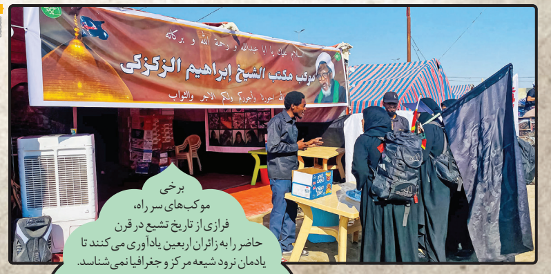
برخی موکب‌های سر راه، فرازی از تاریخ تشیع در قرن حاضر را به زائران اربعین یادآوری می‌کنند تا یادمان نرود شیعه مرکز و جغرافیا نمی‌شناسد.