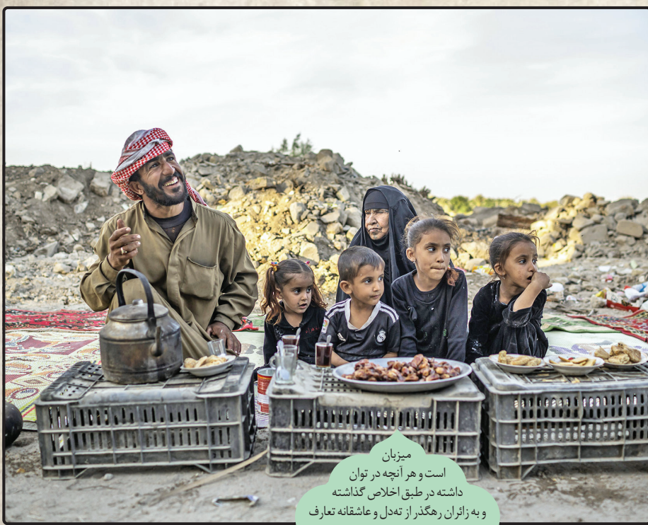
میزبان است و هر آنچه در توان داشته در طبق اخلاص گذاشته و به زائران رهگذر از تعدد و عاشقانه تعارف می‌کند.

الحق و الانصاف که رسم میزبانی را برادران و خواهران شیعه عراقی در ایام اربعین خوب به جا آورده‌اند. از همه بضاعت و توان خود برای میزبانی از زائران اربعین بهره برده‌اند و خاطرات خوشی از این سفر معنوی در یاد و خاطر تک تک مسافران به جا گذاشته‌اند.