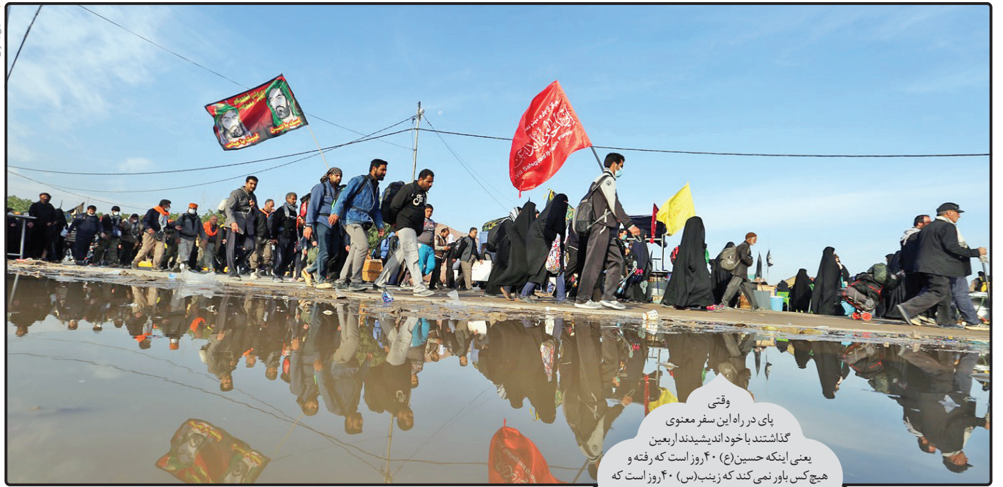
وقتی پای در راه این سفر معنوی گذاشتند با خود آندشیدند اربعین یعنی اینکه حسین (ع) ۴۰ روز است که رفته و هیچ کس باور نمی‌کند که زینب (س) ۴۰ روز است که بدون حسین سر کرده است.