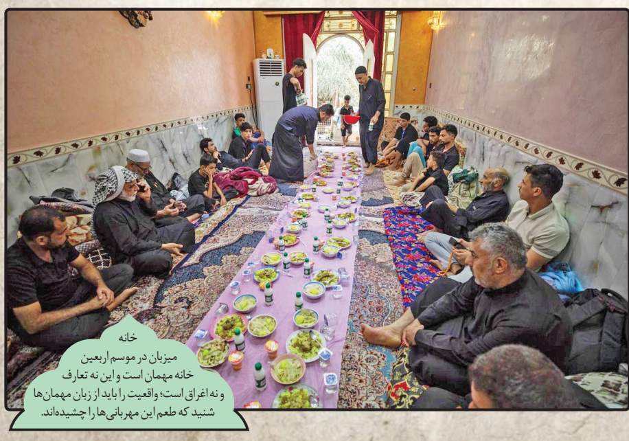
خانه میزبان در موسم اربعین خانه مهمان است و این نه تعارف و نه اغراق است؛ واقعیت را باید از زبان مهمان‌ها شنید که طعم این میزبانی‌ها را چشیده‌اند.