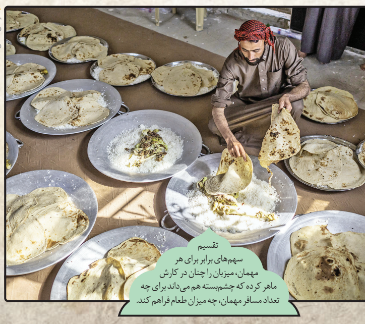
تقسیم سهم‌های برابر برای هر مهمان، میزبان را چنان در کارش ماهر کرده که چشم‌پسته هم می‌داند برای چه تعداد مسافر مهمان، چه میزان طعام فراهم کند.