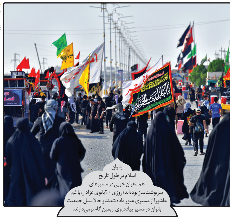
بانوان اسلام در طول تاریخ همسفران خوبی در مسیرهای سرنوشت‌ساز بوده‌اند؛ روزی ۲۰ بانوی عزادار، با غم عاشورا از مسیری عبور داده شدند و خالاسیل جمعیت بانوان در مسیر پیاده‌روی اربعین گام برمی‌دارند.