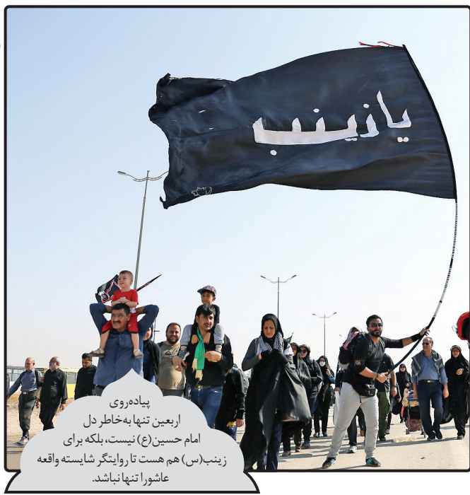
پیاده‌روی اربعین تنها به خاطر دل امام حسین (ع) نیست، بلکه برای زینب (س) هم هست تا رایتگر شایسته واقعه عاشورا تنها نباشد.