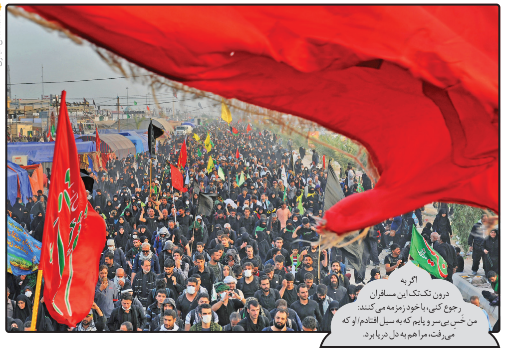
اگر به درون تک‌تک این مسافران رجوع کنی، با خود زمزمه می‌کنند: من خنجر بی‌سر و پایم که به سبیل افتادم/ او که می‌رفت، مرا هم به دل دریا برد.