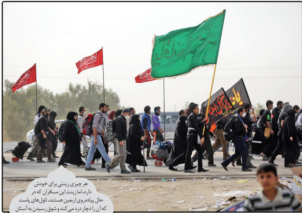
هر چیزی زینتی برای خودش دارد، اما زینت این مسافران که در حال پیاده‌روی اربعین هستند، تاول‌های باست که آن را دچار درد می‌کند و شوق رسیدن به آستان ابا عبدالله الحسین (ع) را لذت‌بخش‌تر.

شور حسین (ع) با تاریخ تشیع چنان عجین شده که تا دنیا دنیا است، شیعه به یاد مظلومیت سیدوسالار شهیدان کر بلا خواهد گریست و اگر مجالی به دست آورد برای عرض ارادت به آستان آن امام همام، راهی سفر پیاده‌روی اربعین خواهد شد.