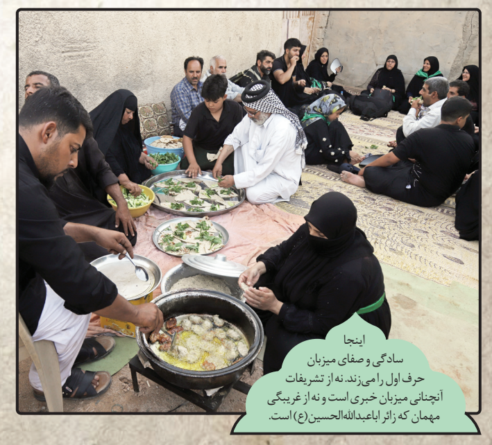
اینجا سادگی و صفای میزبان حرف اول را می‌زند. نه از تشریفات آنچنانی میزبان خبری است و نه از غریبگی مهمان که زائر ابا عبدالله الحسین (ع) است.