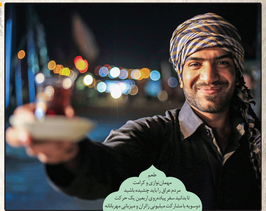
طعم مهمان‌نوازی و کرامت مردم عراق را باید چشیده باشید تا بدانید سفر پیاده‌روی اربعین یک حرکت دوسویه با مشارکت میلیونی زائران و میزبانان مهربانانه عراقی‌هاست.