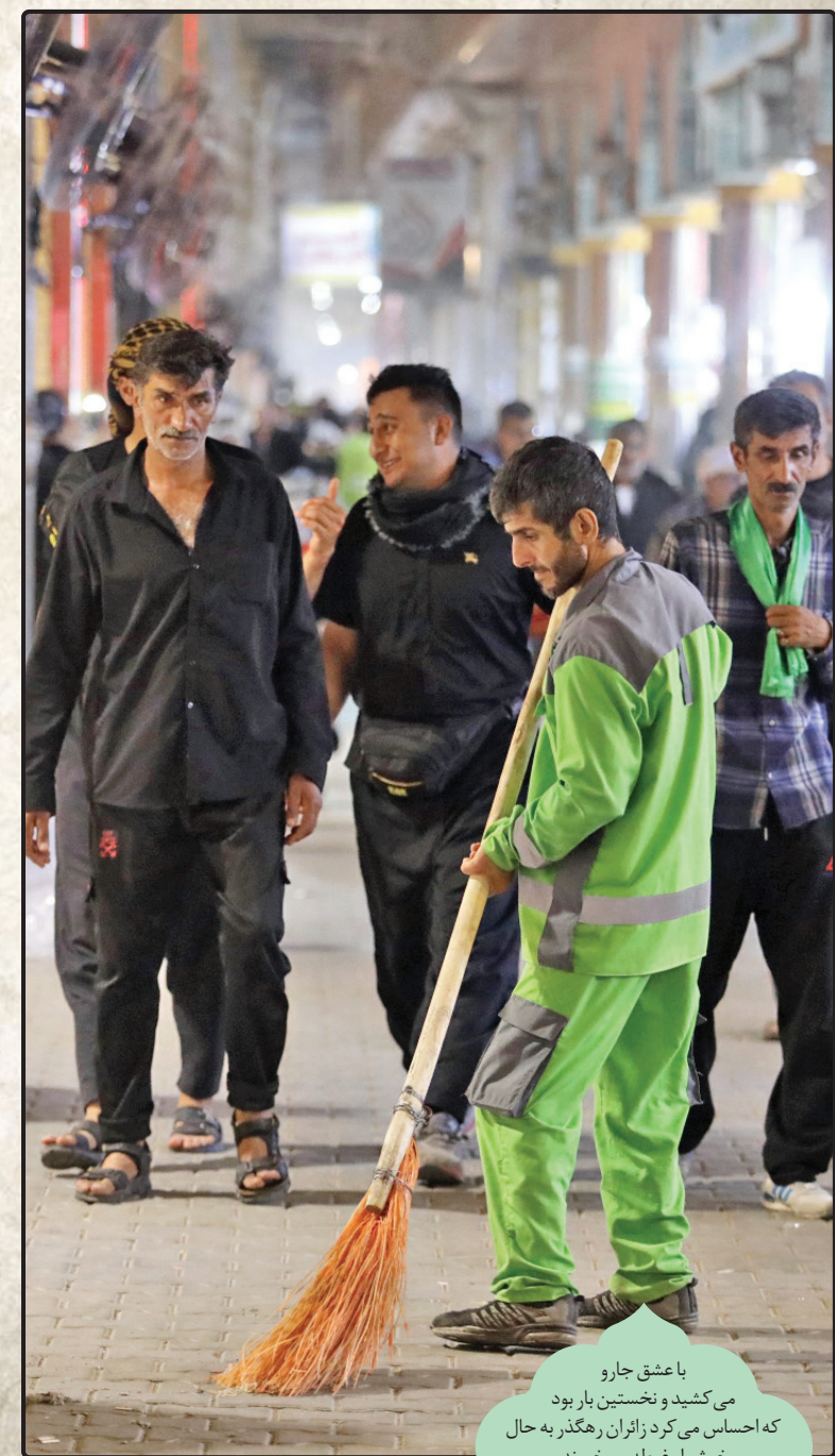
با عشق جارو می کشید و نخستین بار بود که احساس می کرد زائران رهگذر به حال خوش او غیبه می خورند.