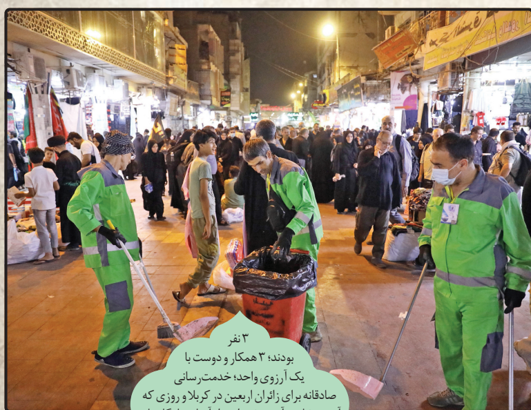
۳ نفر بودند ۳ همکار و دوست با یک آرزوی واحد، خدمت سانی صادقانه برای زائران اربعین در کربلا و روزی که آرزوی شان برآورده شد، این، از آنها به یادگار ماند.