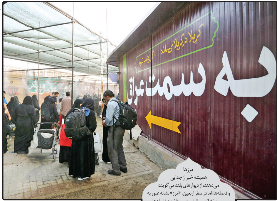
مرزها همیشه خیر از جدایی می دهند؛ از دیوارهای بلند می گویند و فاصله ها، اما در سفر اربعین، «مرز» نشانه عبور به سمت نشانه وصال است و برداشتن فاصله ها.