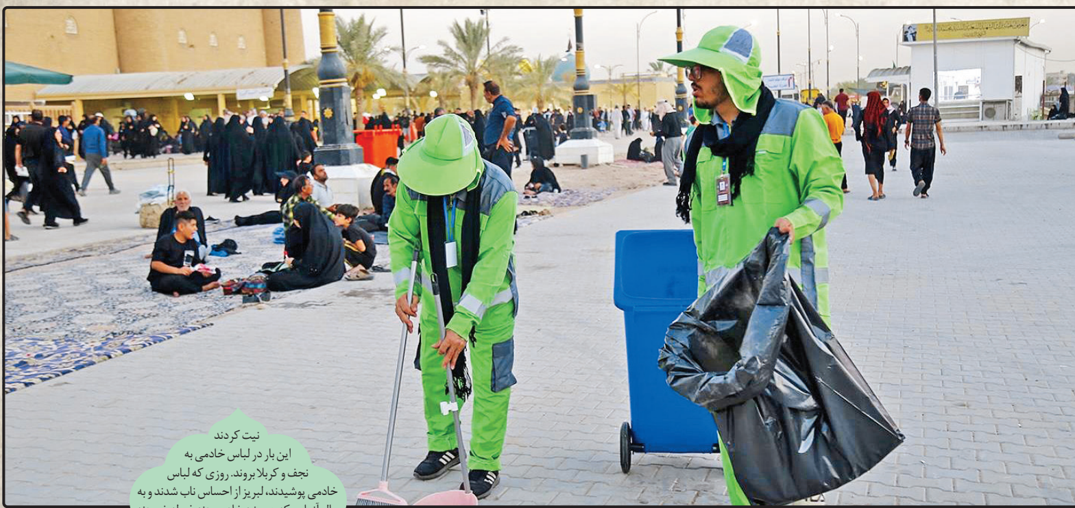
نیت کردند این بار در لباس خادمی به نجف و کربلا بروند. روزی که لباس خادمی پوشیدند، لبریز از احساس ناب شدند و به حال آنهایی که همیشه خادم بودند غیبه خورند.

خیل خادمان و همکاران شهرداری که در ایام اربعین به زائران این سفر معنوی خدمات خالصانه ارائه می دهند، لذت مضاعفی از این موقعیت طلایی که نصیب شان شده می برند؛ هم زائرند و هم خادم و چه احساس نابی بالاتر از این نصیب هر کسی می شود.