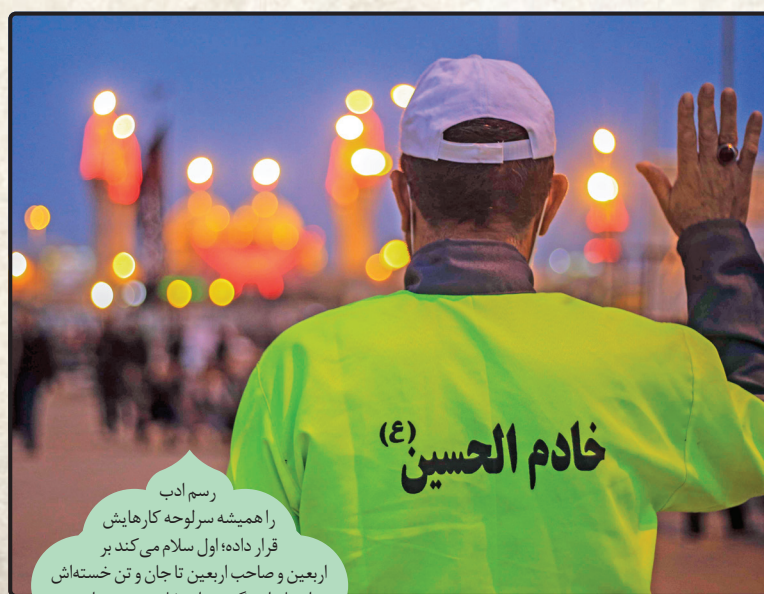
رسم ادب را همیشه سرلوحه کارهایش قرار داده؛ اول سلام می کند بر اربعین و صاحب اربعین تاجان و تن خسته اش توان تازه ای بگیرد برای خادمی موسم اربعین.