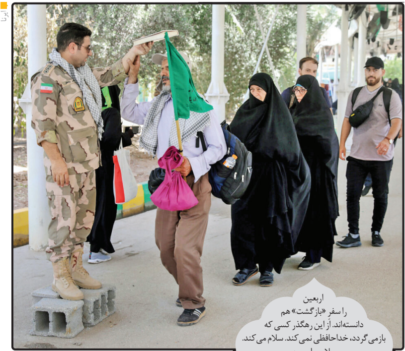
اربعین را سفر «بازگشت» هم دانسته اند. از این رهگذر کسی که بازمی گردد، خدا حافظی نمی کند. سلام می کند. سلام بر اربعین.