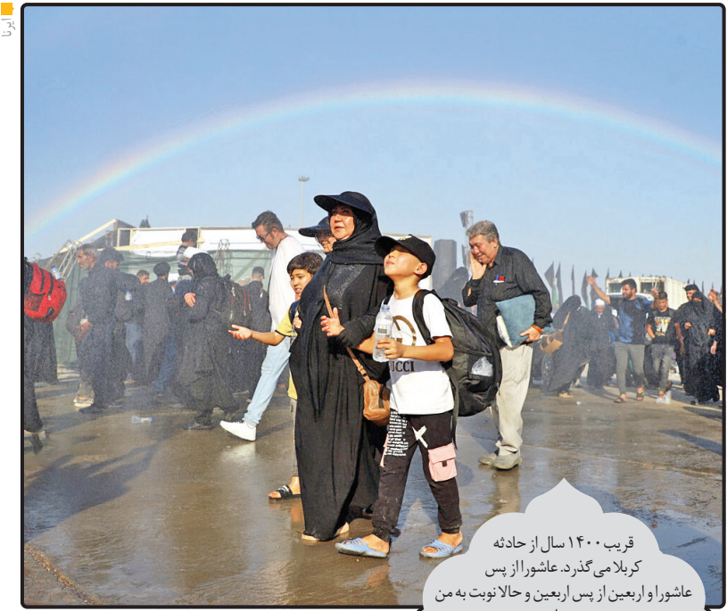
قریب ۱۴۰۰ سال از حادثه کربلا می گذرد. عاشورا از پس عاشورا و اربعین از پس اربعین و حالانوبت به من رسیده است.