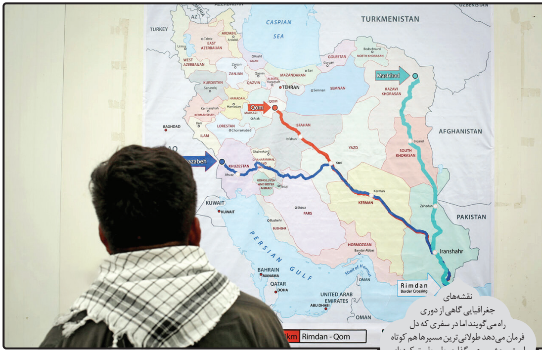
نقشه های جغرافیایی گاهی از دوری راه می گویند اما در سفری که دل فرمان می دهد طولانی ترین مسیرها هم کوتاه است و چشم برهم بگذارای طی طریق کرده ای.