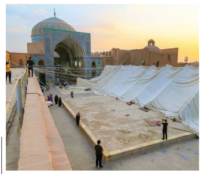
مراسم سنتی پوش کشتی به مناسبت فرارسیدن اربعین حسینی و برگزاری مراسم عزاداری هیئت‌های مذهبی یزد در مسجد جامع، آیین سنتی پوش کشتی با حضور عزاداران حسینی برگزار شد.