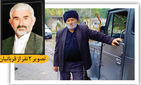
تصویر ۲ نفر از قربانیان