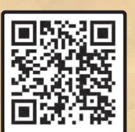
مداحی حاج مهدی رسولی