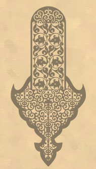
مداحی سید رضایمائی