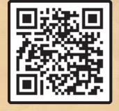
سوز عکاس اسپانیایی در اربعین چه بود؟