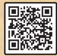
جامانده جا نماند

راهپیمایی اربعین به راستی قصه دلدادگی است. در متن پرخروش این پیاده روی عظیم، روایت های شنیدنی منحصر به فردی هست که شماری از خواندنی ترین شان را از زبان رهروان این مسیر تابناک برایتان تدارک دیده ایم؛ از روایت زنی ایتالیایی تا قصه استاد دانشگاهی در فرانسه و گفتاری از شیخ احمد کافی (ره) همه و همه نکته دار و شایسته درنگ.