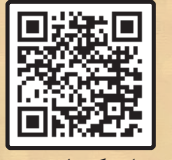
روایت گنده لاتی که در پیاده روی اربعین توبه کرد