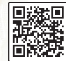
سخنرانی مقام معظم رهبری در ۵۰ سال پیش