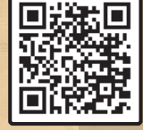
استاد عابدینی در اربعین همه احکام و اخلاق و عقاید در ارتباط با امام معنا می شود.