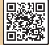
آیت الله میرباقری تحلیلی تاریخی و راهبردی با تکیه بر آموزه های قرآن از اجتماع اربعینی زائران سیدالشهدا