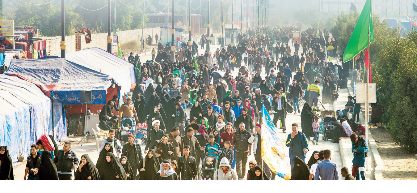
مکتب همشهری رضاحان بخوبی

بعد از حضور باشکوه مردم و علی‌الخصوص جوانان در مراسم محرم امسال و در ادامه آیین بدرقه زائران حسینی، آمارها از حضور چشمگیر جوانان و حتی خردسالان در راهپیمایی اربعین ۱۴۰۲ خبر می‌دهد. در همین زمینه از دیگر آمارهای جالبی که پیش‌تر ستاد مرکزی اربعین منتشر کرده بود، حضور ۱۸درصدی زائران کودک در راهپیمایی اربعین پیش‌روست. آمار دیگری که چندی پیش در رادیو اربعین اعلام شد، حضور بیش از ۱۰هزار کودک زیر ۵سال در مراسم راهپیمایی اربعین ۱۴۰۲ است. این آمار در حالی در سامانه ساحت ثبت شده‌است که شاید بسیاری از زائران بدون ثبت‌نام در سماح به پیاده‌روی اربعین روند.