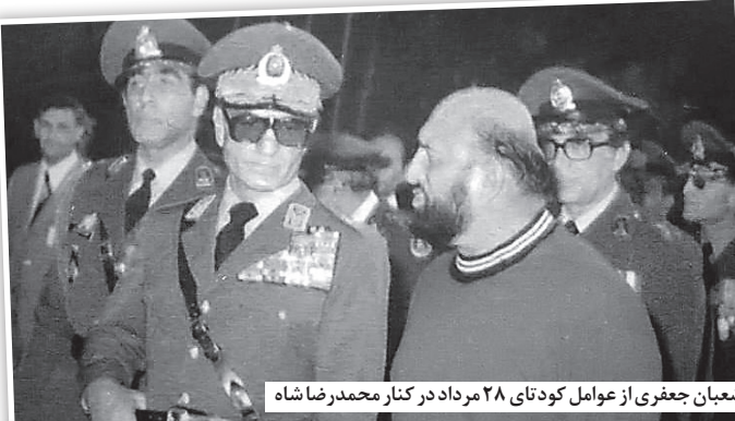
شعیان جعفری از عوامل کودتای ۲۸ مرداد در کنار محمد رضا شاه

با انتشار ویراست تازه اسناد سیا درباره ایران، مشخص می‌شود که چگونه می‌توان کودتای ۱۳۳۲ را رد کرد و با ملی شدن نفت هم مخالف بود؛ البته اطلاع از حضور «جورج مک‌گی» در مقام یکی از صاحبان شرکت نفتی تگزاس اوایل و معاون وزارت خارجه کابینه ترومن در ایران کفایت می‌کند برای فهم چرایی اهمیت ملی شدن نفت و نسبت دقیق و درستش با کودتای ۲۸ مرداد: «دولت متوجه سخت‌تاز با ملی شدن نفت مخالف است؛ زیرا چنین اقدامی امتیازات نفتی آمریکا، بریتانیا و دیگر شرکت‌ها در جهان را به خطر می‌اندازد.» این اثر پژوهش تازه «پرواند آبراهامیان» با نظر به ویراست تازه اسناد محرمانه سازمان سیا است که نشان می‌دهد آمریکا چگونه از لحظه‌های آغازین ملی شدن نفت، مداخله جدی و علنی‌اش در ایران را آغاز کرده است.