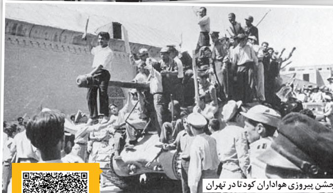
جشن پیروزی هواداران کودتا در تهران