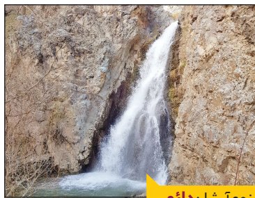
نوع آبشار: دائمی

راه‌های دسترسی با خودروی شخصی: از میدان بهارن در شهران، به سمت مسیر جاده سولقان حرکت کنید و در ادامه جاده امامزاده داوود، نرسیده به امامزاده سمت راست جاده فرعی‌ای وجود دارد که به روستای کیگا می‌رسد.