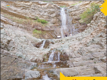
نوع آبشار: دائمی

راه‌های دسترسی با خودروی شخصی: اتوبان تهران-کرج، پس از ورودی پمپ بنزین وارد حرکت کنید و به سمت خیابان شهید اردستانی بروید. در ادامه مسیر تابلوی روستای وردیج و واریش نصب شده که باید مسیر آتجار در پیش گرفت.