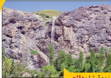
نوع آبشار: دائمی

راه‌های دسترسی با خودروی شخصی: باید به غرب تهران بروید و از خیابان کوهسار در منطقه شهران به جاده کن سولقان وارد شوید. روستای سنگان در مسیر دسترسی به امامزاده داوود قرار دارد و تابلوی مسیر فرعی این روستا در ۱ کیلومتری جاده کن سولقان به چشم می‌خورد.