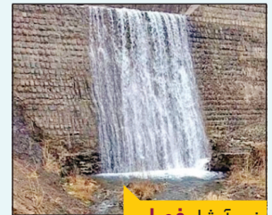
نوع آبشار: فصلی

کمی پایین تر از پل قدیمی جاده تهران شمال، آبشار آرزوها قرار دارد و علاوه بر گردشگرانی که در اطراف آن اتراق می‌کنند و از هوای خوش ارتفاعات و فضای سبز محیط بهره‌مند می‌شوند، محلی مناسب برای کوهنوردانی است که از دره هفت سنگ به سمت قله سنبل در حرکتند. آبشار آرزوها با ارتفاع ۱۰ متری از این روزها با وجود استفاده از آب آن برای مصارف کشاورزی و طرح‌های جهاد سازندگی، همچنان پر آب است. البته در فصل پاییز حجم آب آن چند برابر می‌شود. گفته می‌شود در گذشته‌های دور در یکی از زمین‌های اهالی قرار داشت که نزدیکی هم چند درخت بید بود. فرزندان مالک همیشه آرزوی دیدن این درختان را داشتند. به همین دلیل محلی‌ها نامش را آبشار آرزوها گذاشتند.