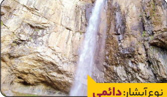
نوع آبشار: دائمی

یکی از بلندترین آبشارهای طبیعی به حساب می‌آید و در دامنه کوه «گندم چال» در نزدیکی روستای خور قرار دارد و برای رسیدن به آن باید یک ساعت پیاده‌روی کرد و در این مسیر از میان باغ‌های میوه گذشت. به همین دلیل حتی در تابستان پیاده‌روی در مسیر تحمل‌پذیر است. این آبشار در تابستان پر آب است و به همین دلیل باید کفش مناسب همراه داشت و در تمام فصول سال دیدنی است. طبیعت پر دار و درخت و سرسبز بهار و تابستان بخشی از زیبایی‌های این آبشار را نشان می‌دهد و تصویر آبشار یخ‌زده در زمستان بخشی دیگر از زیبایی آن را.