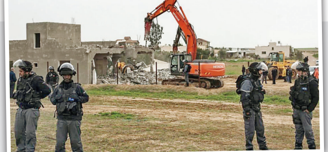
تخریب یک روستای فلسطینی برای دویست و بیست‌مین مرتبه بلدوزهای رژیم صهیونیستی روز سه‌شنبه منازل فلسطینیان روستای «العراقیب» در سرزمین‌های اشغالی سال ۱۹۴۸ را برای دویست و بیست‌مین بار تخریب کردند. صهیونیست‌ها برای اولین بار در ۲۷ جولای ۲۰۱۰ (۵ مرداد ۱۳۸۹) خانه‌های این روستا را تخریب کرده بودند.

بلینکن: نمی‌توانم گزارش‌ها درباره کشتن برنامه هسته‌ای ایران را تأیید کنم آنتونی بلینکن، وزیر خارجه آمریکا در واکنش به گزارش روزنامه وال استریت ژورنال که مدعی کشتن برنامه هسته‌ای ایران شده بود گفت نمی‌تواند این گزارش را تأیید کند. جمع‌گذاشته روزنامه وال استریت ژورنال به نقل از منابع ناشناس مدعی شده بود که آنتونی بلینکن، وزیر خارجه آمریکا در واکنش به گزارش روزنامه وال استریت ژورنال که مدعی کشتن برنامه هسته‌ای ایران شده بود گفت نمی‌تواند این گزارش را تأیید کند. جمع‌گذاشته روزنامه وال استریت ژورنال به نقل از منابع ناشناس مدعی شده بود که