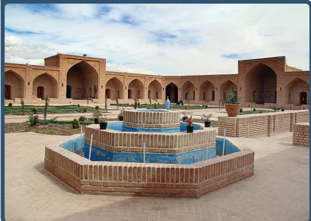
کاروانسرای شاه‌عباسی ده نمک

کاروانسرای ده نمک یا شاه‌عباسی از کاروانسراهایی است که در دوران صفوی و در شهرستان آرادان روستای ده نمک بنا شد. این بنا امروزه بعد از ترمیمی که روی آن صورت گرفت به یکی از اقامتگاه‌های بومگردی این شهرستان تبدیل شده است و در سال ۱۳۵۳ در لیست آثار ملی ایران جای گرفت. در ساختار این بنا می‌توانید تمامی جزئیات معماری دوران صفوی را مشاهده کنید. این کاروانسرا از جمله کاروانسراهایی است که در مسیر جاده ابریشم در ایران قدیم ساخته شد و یکی از مهم‌ترین کاروانسراهای آن دوران محسوب می‌شود. قرارگیری این کاروانسرا در ناحیه کویری سبب شده تا در شب آسمانی زیبا و پرستاره داشته باشد که بازدیدکنندگان بسیاری را به خاطر این ویژگی، به سوی خود جذب می‌کند.