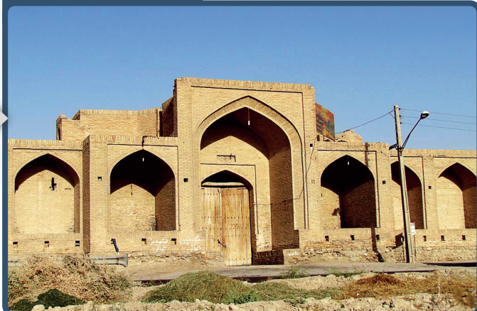
کاروانسرای لاسجرد - دوره صفوی

کاروانسرای لاسجرد اثری بر جای مانده از دوران شاه عباس اول صفوی است؛ دورانی که ایران یکی از قدرتمندترین حکومت‌های خود را داشت. با روی کار آمدن شاه‌عباس بزرگ و بعد از ۴۲ سال حکمرانی این پادشاه مقتدر و سخت‌گیر بر ایران، شاهد شکوفایی اقتصادی، امنیتی، نظامی و سیاسی در آن روزگار هستیم. کاروانسرای لاسجرد هم محصول همین شکوفایی است؛ دورانی که در آن راه‌های این سرزمین آنقدر امن بود که بتوان در آن بدون دغدغه شروع به سفر کرد و تجارت انجام داد، در میانه راه هم بتوان در کاروانسراها خستگی از تن در کرد.