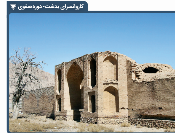
کاروانسرای بدشت- دوره صفوی

برج مهماندوست در جنوب روستای مهماندوست قرار دارد. این روستا در نزدیکی روستای امام‌آباد و در ۲۰ کیلومتری شمال شرقی شهر دامغان قرار گرفته است. این برج در میان راه دامغان به شاهرود واقع است. این برج آجری یادگاری از دوران سلطنت سلجوقیان است و با قدمتی تقریباً هزار ساله، هنوز هم پایرجاست. طبق یافته‌های موجود، دستور ساخت برج مهماندوست توسط سلطان سنجر سلجوقی صادر شده بود. این برج قدیمی رازهای زیادی در دل خود دارد؛ از حوادث و بلایای طبیعی گرفته تا جنگ‌های مختلف، مانند جنگ نادرشاه افشار و اشرف افغان که به پیروزی نادرشاه انجامید.