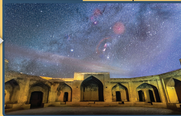
کاروانسرای روستای باستانی قوشه

کاروانسرای قوشه در زمان صفویه و به سبک معماری چهارایوانی ساخته شده است و امروزه، از آثار تاریخی و دیدنی‌های دامغان به شمار می‌رود. از خارج این کاروانسرا به‌صورت مربع و از داخل به شکل هشت‌ضلعی دیده می‌شود. در مقابل کاروانسرا نیز آب‌انباری تاریخی نیز وجود دارد که در گذشته از آن برای تامین آب مورد نیاز مسافران استفاده می‌شد. کاروانسرای قوشه با به‌کارگیری گچ و آجر ساخته شده است و هفت برج مدور در چهار گوشه و نیز در میانه سه ضلع خارجی بنا به چشم می‌خورد.