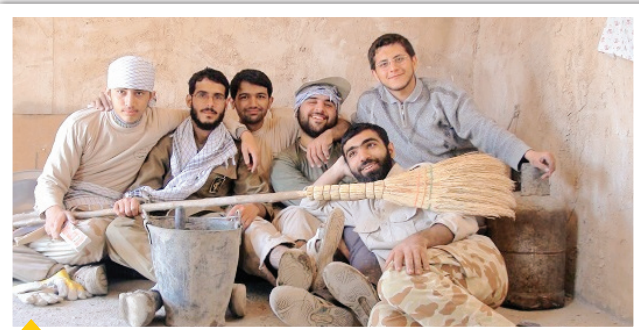
شهید حسین مومنی (نفر اول از سمت راست): هر چه جامان تنگ‌تر، دل‌هایمان دریا تر است، رود وقتی پر شود، آغوش، دریا می‌کند...