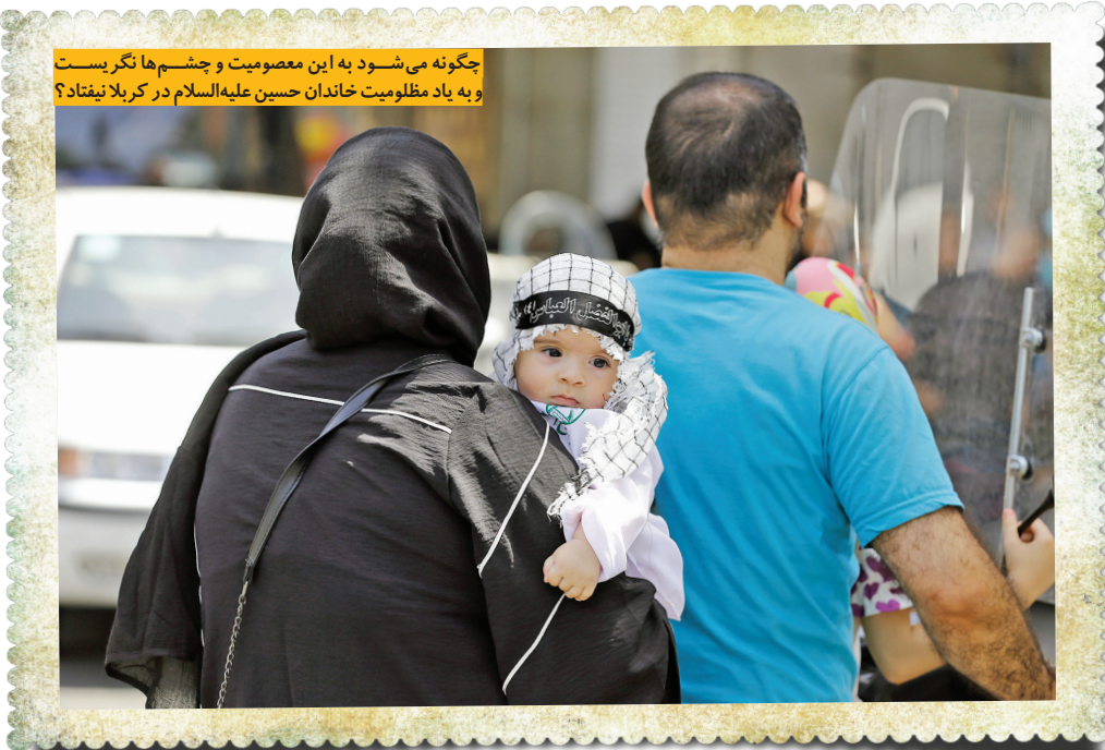
چگونه می‌شود به این معصومیت و چشم‌ها نگر نیست و به یاد مظلومیت خاندان حسین علیه‌السلام در کربلا نیتقاد؟