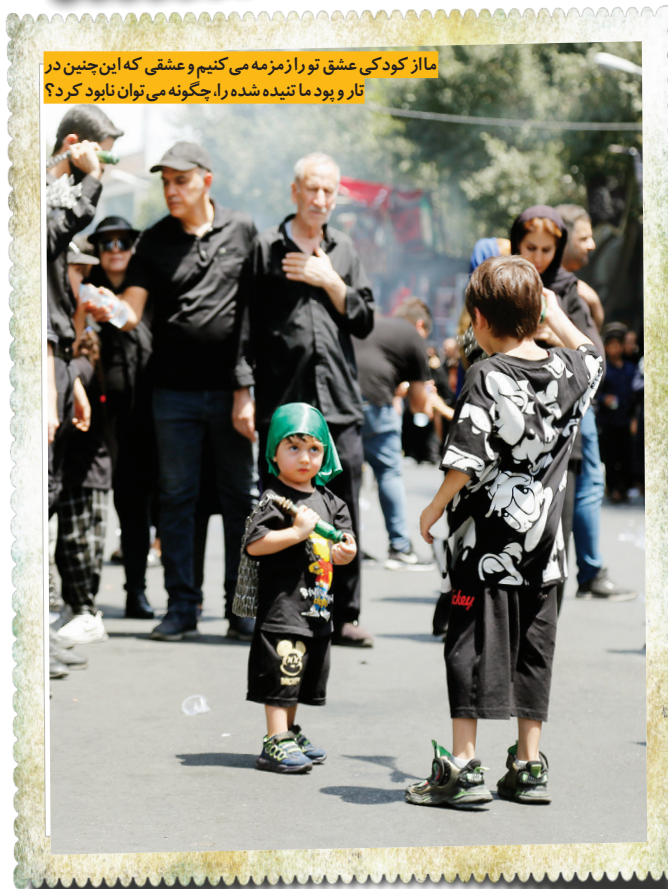
ماز کودک عشق تو را زمزمه می‌کنیم و عشقی که این چنین در تار و پود ما تنیده شده را، چگونه می‌توان نابود کرد؟