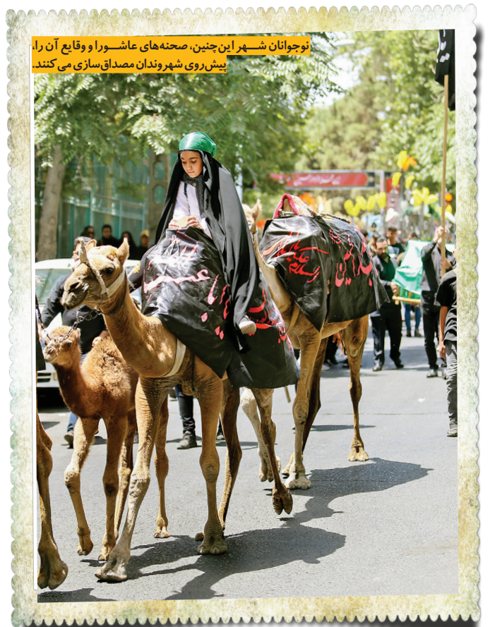
نوجوانان شهر این چنین، صحنه‌های عاشورا و وقایع آن را، بیش‌رو شهرزدان مصداق‌سازی می‌کنند.