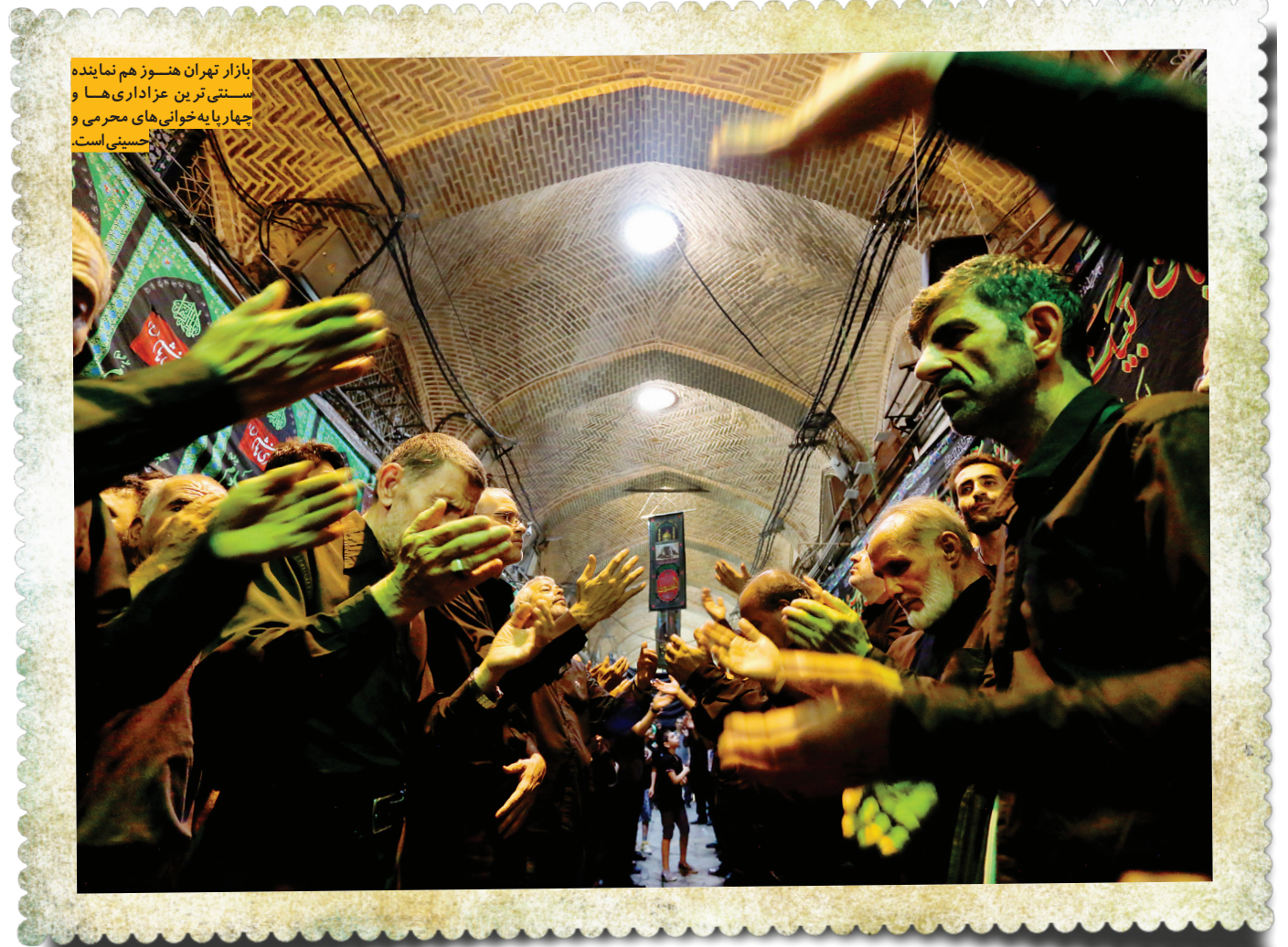
بازار تهران هنوز هم نمایندگی سستی‌ترین عزاداری‌ها و چهارپایه خوانی‌های محرمی و حسینی است.