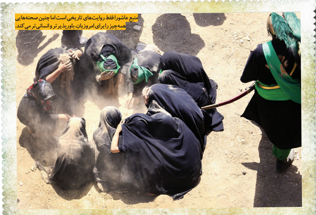
منبع عاشورا فقط روایت‌های تاریخی است اما چنین صحنه‌هایی همه چیز را برای امروزیان، باورپذیرتر و انسانی‌تر می‌کند.