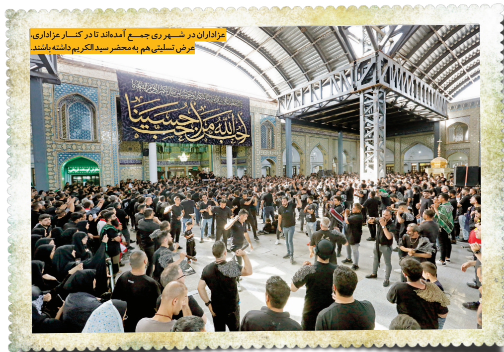
عزاداران در شهر ری جمع آمده‌اند تا در کنار عزاداری، عرض تسلیتی هم به محضر سیدالکرم داشته باشند.