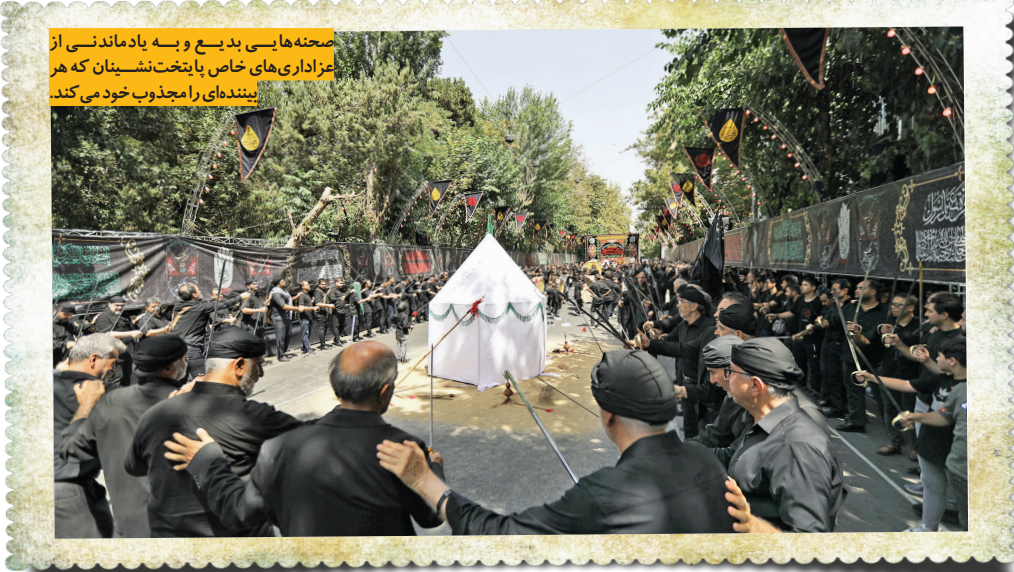
صحنه‌ها بسی بدیع و بیه یادماندنی از عزاداری‌های خاص پایتخت‌نشینان که هر بیننده‌ای را مجذوب خود می‌کند.

و در خیابان‌ها به هم راه نمی‌دادند و... با هم در حسینیه‌ها، هیئت‌ها و مسجدها، جمع آمدند و به عزاداری پرداختند و شهری دیگر را ساختند؟ چه چیزی آنها را گردهم آورد و خواهد آورد؟ این، عشق حسین (ع) بود که مانند نخ تسبیح این شهر پراکنده، این ایرشهر فر دیت یافته را به هم پیوند داد تا بفهمیم که شهر حسینی یعنی چه؛ شهر عاشورایی یعنی