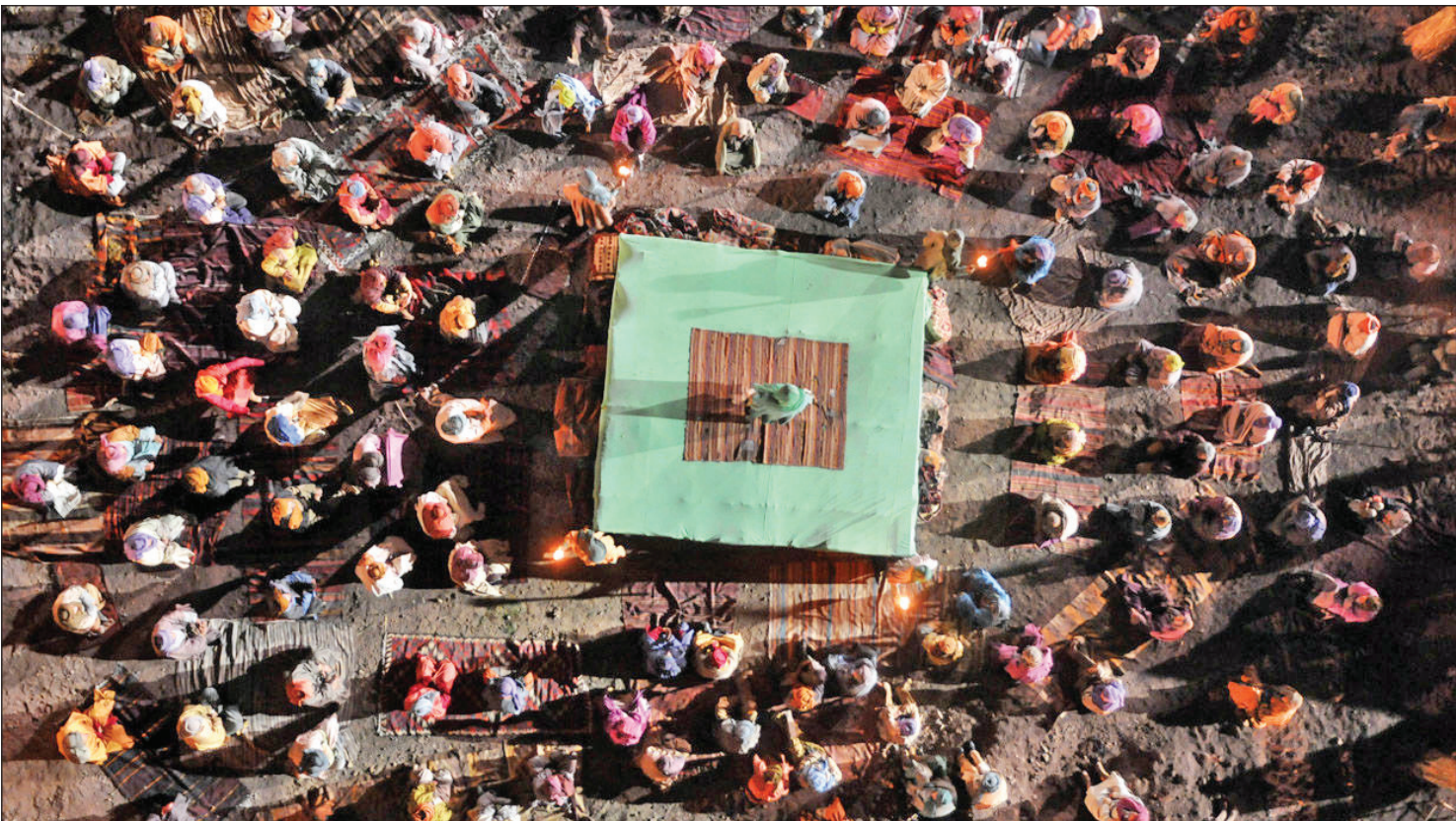
نمایی از قیام سناخیز