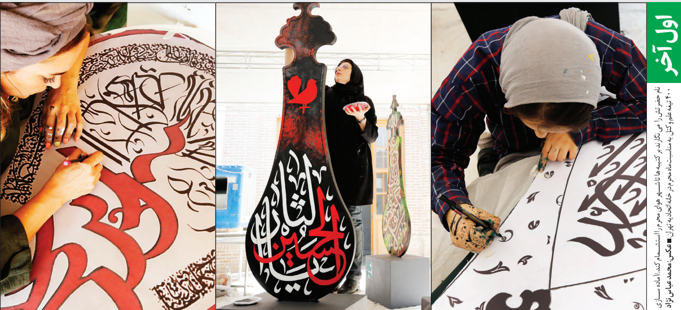
اول آخر ۲۰۰۰هجمه عموگنل به مناسبت ماه مهر در حلقه آینه‌های تهران

بستنی خوردن، بهانه نمی‌خواهد، امروز روز جهانی بستنی است، و مردم زیادی در سراسر دنیا تریب می‌شوند بستنی بخورند. ما هم می‌توانیم دانه‌مان را شیرین و دلمان را خنک کنیم و قدر دان اجداد خیلی خیلی دورمان باشیم.