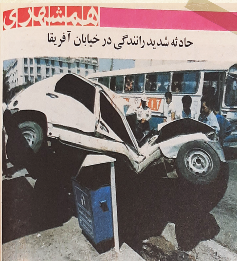
سرویس حوادث: به دلیل خیابان آفریقا با دکه روزنامه‌فروشی به شدت برخورد کرد و واژگون شد. در این حادثه سه مرد سرنشین مت، است، و قصاب که حمله کردند.

او در بازجویی اعتراف کرد که ۱۰ تخته فرش، ۱۱ دستگاه تلویزیون و ۲ آویز سرقت کرده است. او بیشتر سرقت‌هایش را در یونک، صادقیه، شهرک قدس و غرب تهران مرتکب شده بود. مأموران بعد از بررسی ده‌ها مورد سرقت شبیه به هم و با استفاده از مدرن‌ترین امکانات آن روزها که انگشت‌نگاری بود موفق شدند این سارق کهنه‌کار را دستگیر کنند و بار دیگر به زندان بفرستند.