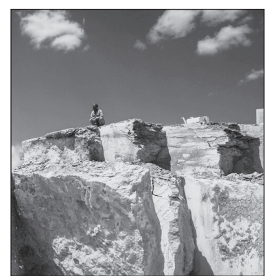
معدن سنگ مرمریت چناران

معدن مرمریت شهید سلیمانی در شهرک صنعتی چناران واقع شده و از فروردین سال ۱۴۰۲ با سرمایه‌گذاری ۵۰ میلیارد تومانی آغاز به کار کرده است. استخراج اسمی این معدن سالانه ۱۰ هزار تن است و در حال حاضر ۲۰ کارگر در آن مشغول به کار هستند. بخش معدن با مشکلات زیادی روبه‌رو بوده و هزینه‌ها در این حوزه بسیار بالاست.