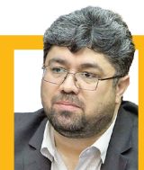
تأدیه بدهی ۱۷۰ هزار میلیارد تومانی

صالح مهدی‌الحسنای، معاون درمان وزارت بهداشت: «مسال گذشته بیش از یک میلیون بیمار غیرایرانی در کشور پذیرش شده‌اند و ۴۷ مرکز درمانی در کشور با استانداردهای پذیرش بیماران خارجی مطابقت دارند. در این مراکز به منظور احترام به حقوق بیمار و سهولت در تعامل و دریافت خدمات بهتر، اطلاعات و اعلان‌ها به زبان انگلیسی و عربی نیز تمهید شده است.»