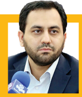
سرمایه‌گذاری برای اشتغال فرزندان بازنشستگان

میرهاشم موسوی‌مهدی‌رعامل سازمان تأمین اجتماعی در سال گذشته و مایل آن، سازمان تأمین اجتماعی ۱۰۶ هزار میلیارد تومان، ایرده‌کار ترس مجموعه به سیستم بانکی کشور شناخته می‌شد، اما با تعامل مثبت سازمان با دولت سیزدهم و مجلس شورای اسلامی بالغ بر ۱۷۰ هزار میلیارد تومان تأدیه بدهی ۱۷۰ هزار نفر بازنشستگی است. حداقل سن بازنشستگی در دنیا ۶۰ سال است و ما کمتر به آن توجه کرده‌ایم. به گفته او، سن بازنشستگی نیاز به اصلاحات دارد. «یکی از موضوعاتی که ما در برنامه هفتم توسعه پیشنهاد دادیم اصلاحات سنجهای این امر است. پیشنهاد دادیم تا پایان برنامه هفتم سن بازنشستگی به ۵۵ و ۵۷ سال برسد، چرا که نرخ امید به زندگی در کشور ما خوب افزایش یافته، اما فاصله سن بازنشستگی ما که ۵۰ سال است تا امید به زندگی که ۷۶ سال است، بسیار زیاد است.»