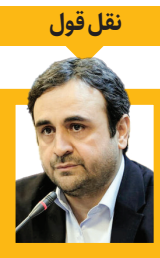
۲۴۷ مرکز درمانی برای بیماران خارجی