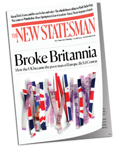
هفته‌نامه نیواسیتسمن [انگلیس]