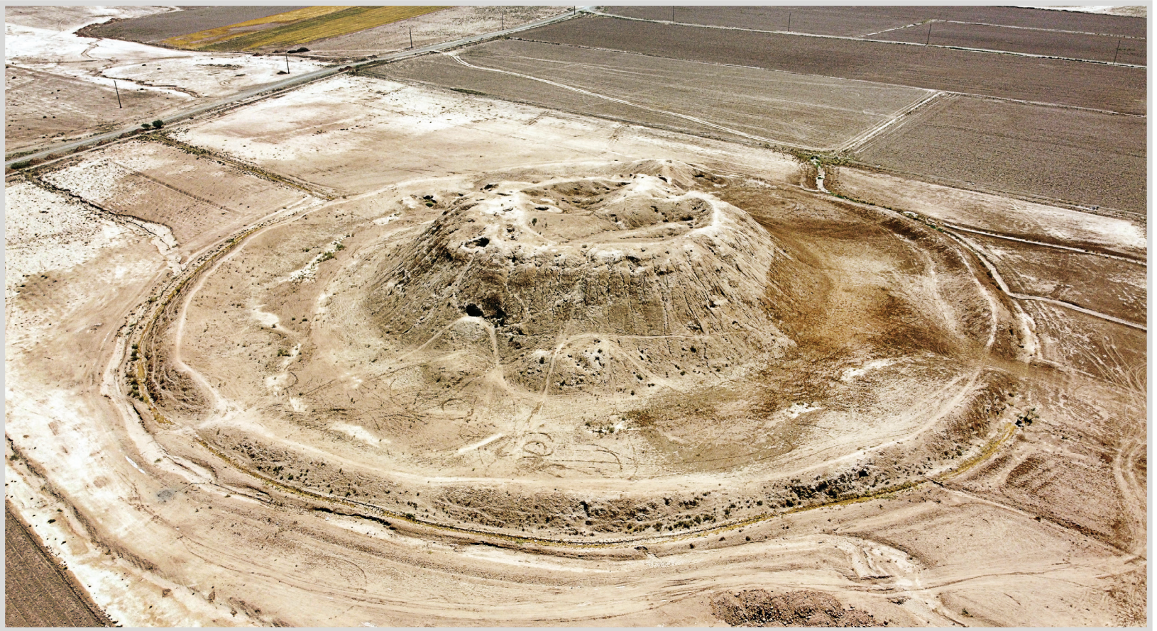
عکس: ساتیارامی / غول تپه - روستای غیاث آباد