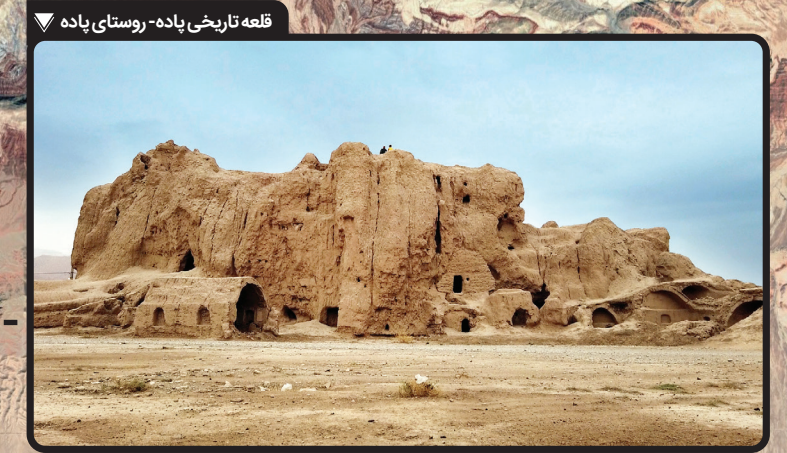
قلعه تاریخی پاده- روستای پاده