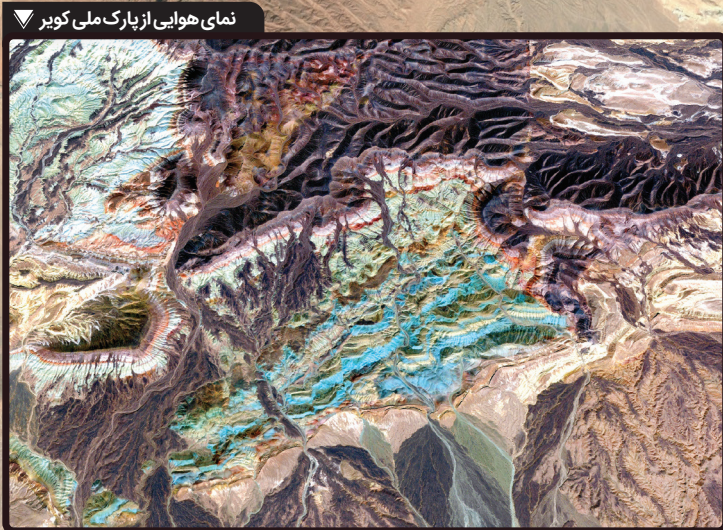
نمای هوایی از پارک ملی کویر