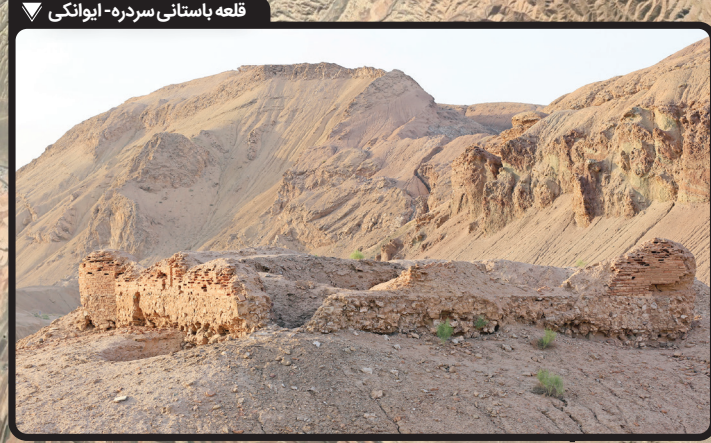
قلعه باستانی سردره- ایوانکی