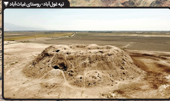
تپه غول آباد- روستای غیاث آباد