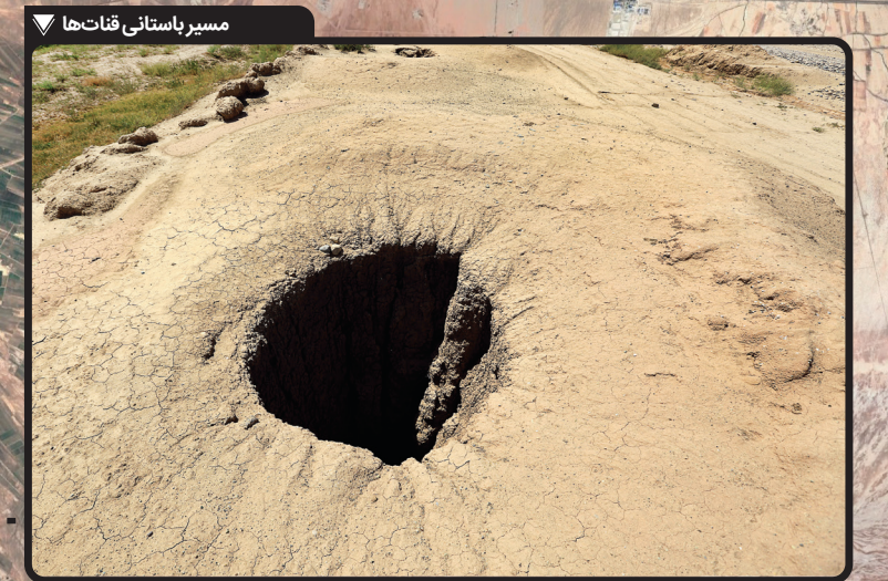
مسیر باستانی قنات‌ها