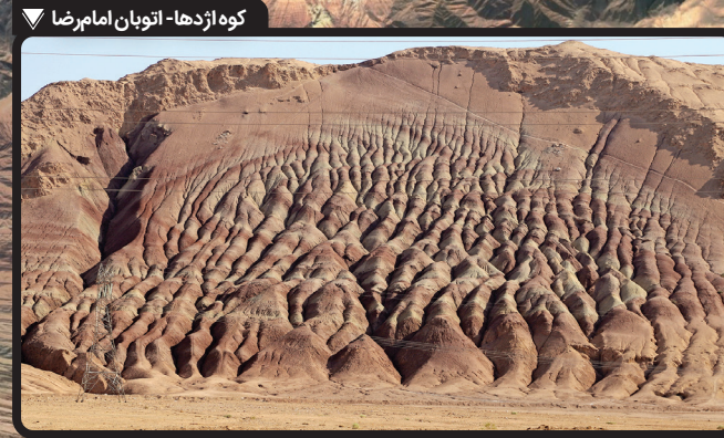
کوه ازدها- اتوبان امامرضا