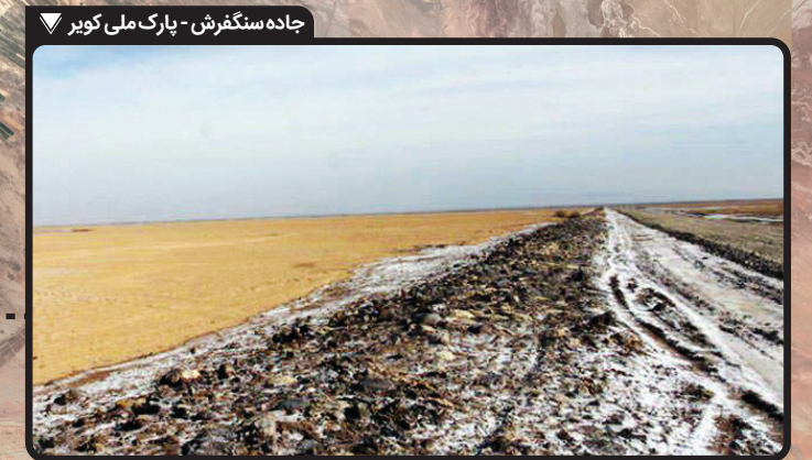
جاده سنگفرش- پارک ملی کویر