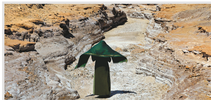
رودخانه باستانی ▲

در طول مسیر رسیدن به کوه اژدها آبراه و پلی قدیمی هم وجود دارد که با اینکه آب ندارد، اما نقش‌ونگار رنگارنگش ما را وادار به توقف می‌کند.