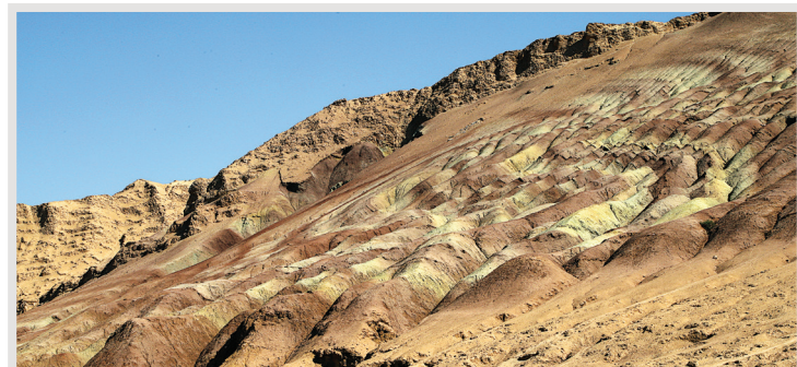
کوه اژدها ▲