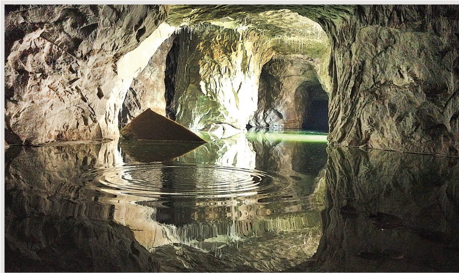
معدن نمک گرمسار ▲

کمی جلوتر از آب انبار قدیمی، بارنگ، روی دیوار آدرس معدنی را نوشته‌اند که حالا جاذبه گردشگری شده است