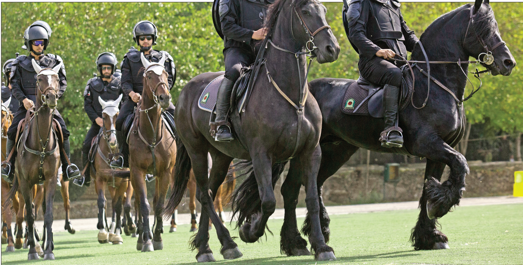
تکس: همشه‌ها/ایمانی تصویر