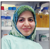
دکتر بهناز حیدرجی کاشف نخستین پادتن ایدن

تعدادشان کم نیست و در موتورهای جست‌وجو گر نامشان را که با عنوان بانوان نخبه و علمی ایرانی پیدا کنید به افراد بسیاری می‌رسید که با حجاب در کشورهای غربی و اروپایی مشغول فعالیت و تحقیق هستند یا در مسابقات تیه‌های پر تر کسب کرده‌اند. گرچه از جمله‌ها و نشریات خارجی به دلیل نوع پوشش و حجابی که دارند، کمتر نام‌شان برده می‌شود اما این بانوان با حجاب بر قله‌های افتخار جهان ایستاده‌اند.