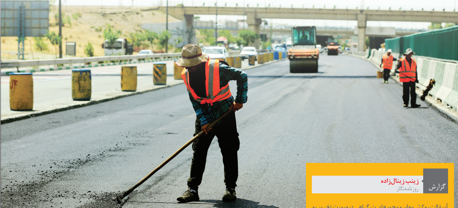
گزارش زینب زینالزاده روزنامه‌نگار

سرپرست معاونت فنی و عمران شهرداری تهران در گفت‌وگو با همشهری وضعیت آسفالت‌ریزی در تهران را تشریح کرد