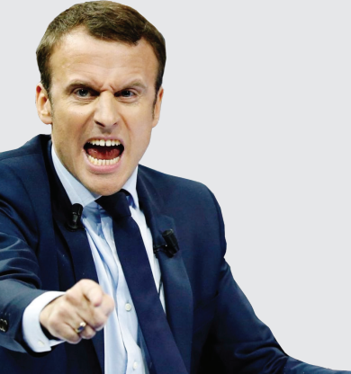
روزنامه لاکروا [فرانسه]