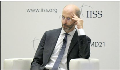
www.iiss.org IISS MD21

گرچه هنوز مشخص نیست کشف چه موضوعی باعث معلق شدن مجوز امنیتی رابرت مالی شده و اینکه این تغییر چه تأثیری بر روند مذاکرات هسته‌ای خواهد داشت، (البته که دولت آمریکا تأکید کرده که هیچ تأثیری نخواهد داشت) اما شواهد چنین برمی‌آید که اقدام وزارت خارجه آمریکا برای تعلیق مجوز امنیتی رابرت مالی در آیین وزارت خارجه یا در داخل دولت جو بایدن به‌طور گسترده اعلام نشده است؛ چرا که وزارت خارجه ترجیح داده احتمالاً به‌دلیل تبعات سیاسی از اعلام چنین خبری خودداری کند و مالی را حتی پس از مسدود شدن دسترسی‌های امنیتی اش مدتی در سمتش حفظ کرده و بیانیه‌ای دربارۀ جایگزینی او صادر نکند. این مسئله زمانی حساسیت‌برانگیز شد که وزارت خارجه در پاسخ به درخواست کنگره برای حضور رابرت مالی در کنگره جهت ارائه پاره‌های توضیحات درباره روند گفتوگوهای هسته‌ای، مرخصی اجباری دیپلمات ارشدش را پنهان کرده و در عوض عنوان کرده که او به‌دلیل بیماری یکی از اعضای نزدیک خانواده در آن بازه زمانی در پستش حضور نداشته است؛ اقدامی که افشای آن خشم مخالفان جمهوری خواه دولت بایدن را برانگیخته و نشانیه تلاش وزارت خارجه آمریکا برای گمراه کردن کنگره را مطرح کرده‌اند.